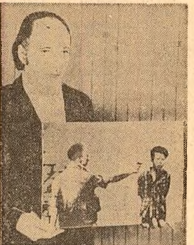
Infățșind imaginea zguduitoare de mai sus — care denunță represiunile barbare ale militarilor administrației saionese împotriva patrioților sud-vietnamezi — fotoreporterul Eddy Adams a câștigat concursul expoziției „Foto-Press Mondial” care a avut loc zilele acestea la Haga

NEW YORK 16 (Agerpres). — Referindu-se la recenta hotărâre a președintelui S.U.A., Richard Nixon, de a continua construirea sistemului de rachete antirachetă „Sentinel”, senatorul Charles Percy a declarat că o astfel de măsură nu va contribui la îmbunătățirea relațiilor și climatului politic internațional, ci va atrage după sine intensificarea cursei înarmării. Alăturându-se criticilor împotriva continuării construirii acestui sistem, senatorul Mark Hatfield s-a pronunțat în același timp pentru dezvoltarea relațiilor cu țările socialiste și recunoașterea drepturilor R. P. Chinei la O.N.U. El a afirmat că elaborarea unor programe de schimburi culturale cu R. P. China ar fi în favoarea ambelor state. Ambii senatori au cerut reducerea operațiunilor militare ale trupelor americane în Vietnamul