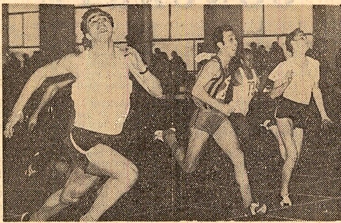
La concursul athletic al studenților

Alte știri din țară și de peste hotare (în pag. a IV-a)