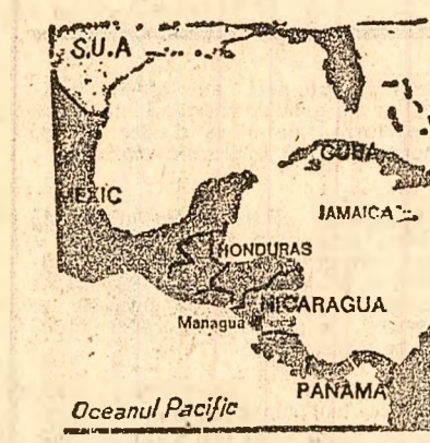
Insula Anguilla s-a retras la 31 mai 1967 din Federația creată împreună cu Insulele St. Kitts și Nevis, deoarece a fost supusă unui tratament de inferioritate. În luna ianuarie a acestui an, populația insulei a hotărât în cadrul unui referendum, să devină complet independentă față de Marea Britanie.