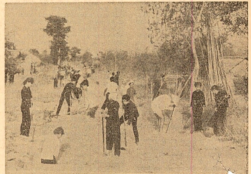
În sprijinul forțelor patriotice, populația din Vietnamul de sud blocază drumurile strategice ale inamicului

HANOI 23 (Agerpres). — Unlătăți ale apărării anti-aeriene din provincia Nam Ha au doborât un avion de recunoaștere american care violase spațiul aerian al R.D. Vietnam, transmite agenția V.N.A. Potrivit unor date suplimentare, la 19 martie un alt avion american a fost doborât deasupra provinciei Nghe An. Numărul total al avioanelor americane doborâte deasupra teritoriului R.D. Vietnam se ridică la 3.272.