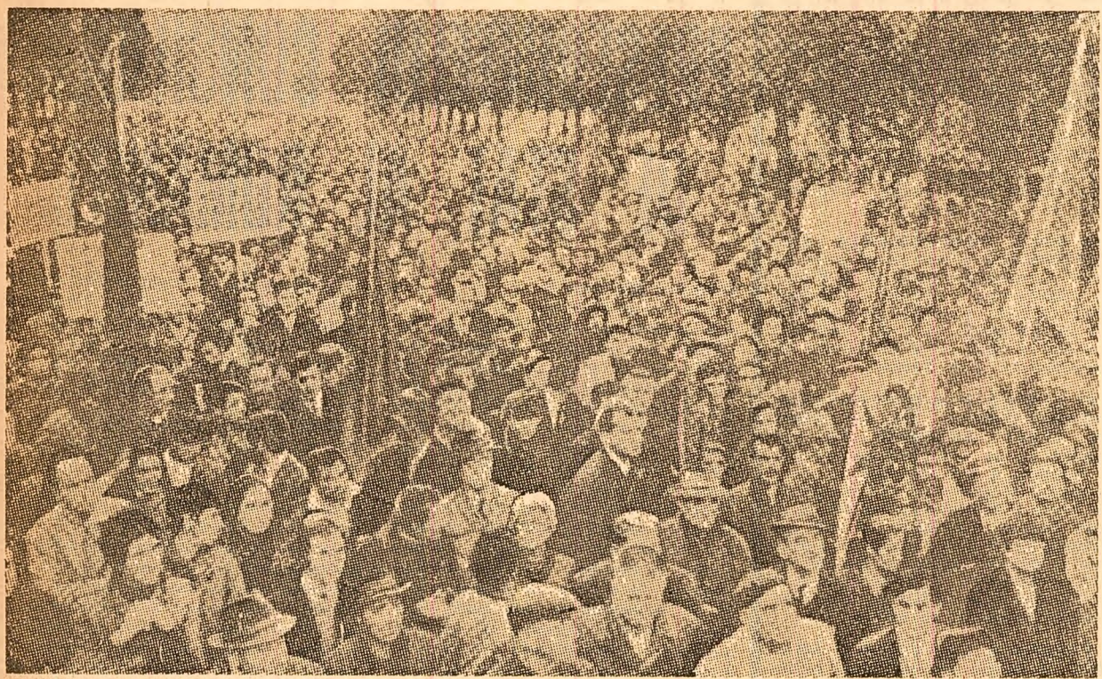
Peste 20.000 de genovezi au organizat zilele trecute un marș, cerînd ieșirea Italiei din N.A.T.O.