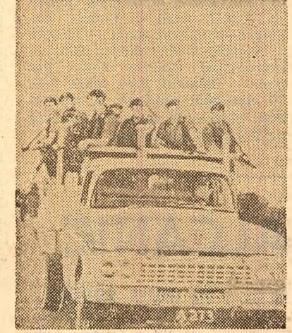
Ronald Webster, președintele Anguilei, a sosit la New York pentru a cere la Națiunile Unite trimiterea unei misiuni de anchetă în Anguilla, ocupată zilele trecute de parașutiști britanici. La sosire, el a declarat că a părăsit în secret insula, fiind în posesia unor știri, potrivit cărora urma să fie arestat. În fotografia militară britanică pînălind pe insulă

Participanții la Conferința Organizației regionale a Partidului Social-democrat din landul Hessa, desfășurată la Frankfurt pe Main, au adoptat o rezoluție în care se cere recunoașterea Republicii Democratice Germane de către guvernul R.F.G. Participanții s-au pronunțat totodată pentru recunoașterea frontierei de pe Oder-Neisse.