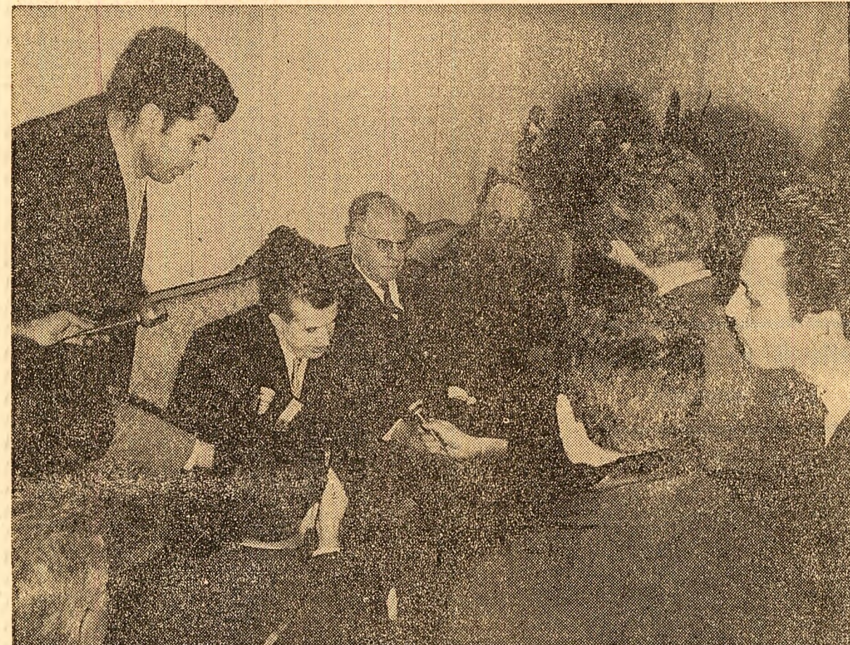
Inconjurat de ziaristi