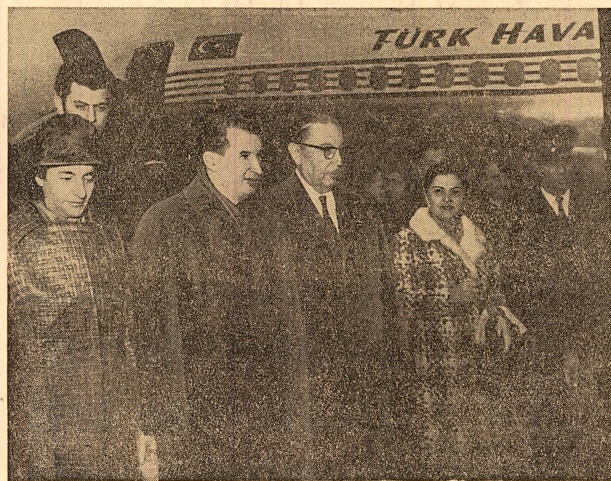
Pe aeroportul Yeşilköy din Istanbul

litatea sa politică și acțiunile consecvente de pace și colaborare între state pe care le promovează România. Insemnătatea vizitei președintelui Nicolae Ceaușescu în Turcia pentru dezvoltarea relațiilor de colaborare dintre cele două țări este scoasă în evidență de către toate marile cotidiane turce, care, și astăzi, consacră acestui eveniment ample comentarii, reportaje, fotoreportaje. Ziarele „Cumhuriyet”, „Vatan”, „Ankara Express”, precum și alte ziare din Ankara și Istanbul reliefează în numerele lor de astăzi importanța convorbirilor oficiale româno-turce purtate ieri la Palatul Prezidențial din Ankara. Referindu-se la aceste convorbiri, coti-