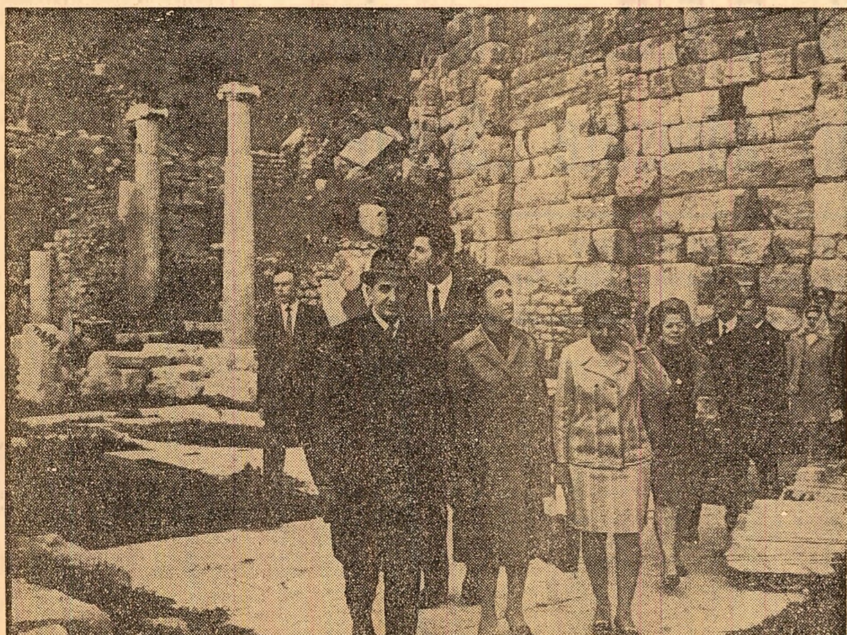
Printre monumentele Efesului, la puțin timp după sosirea la Izmir