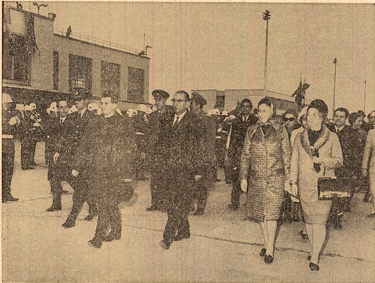
Pe aeroport, la plecarea din Istanbul

După o primire sărbătorească la Izmir, au fost vizitate vestigiile celebrului Efes