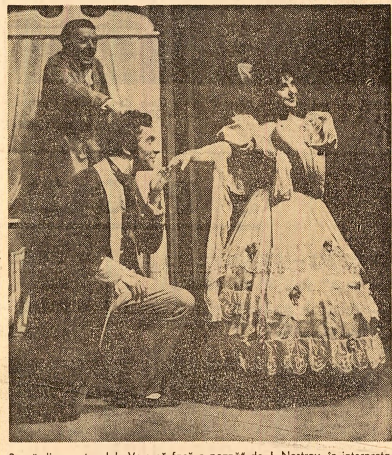
Scenă din spectacolul „Vrea să facă o pozna” de J. Nestrov, în interpretarea artiștilor Teatrului german din Timișoara.