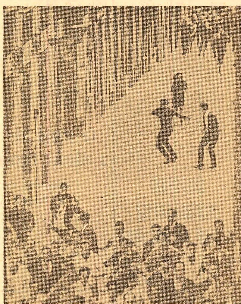
În diverse orașe din Spania au avut loc demonstrații ale populației împotriva prezenței bazelor militare americane pe teritoriul țării. În fotografie: demonstrații pe o stradă din Madrid împărășită de poliție

BUDAPESTA (Agerpres). — Agenția M.T.I. a transmis o declarație a Ministerului Afacerilor Externe al R. P. Ungare, în care se arată că, în numele R. P. Bulgaria, R. S. Cehoslovace, R. D. Germane, R. P. Polone, Republicii Socialiste România, R. P. Ungare, U.R.S.S., șefii misiunilor diplomatice ungare în țările europene transmise în aceste zile guvernelor țărilor europene Apelul statelor participante la Tratatul de la Varșovia către toate statele europene, semnat la Budapesta la 17 martie 1969 de la Budapesta a Comitetului politic Consultativ.