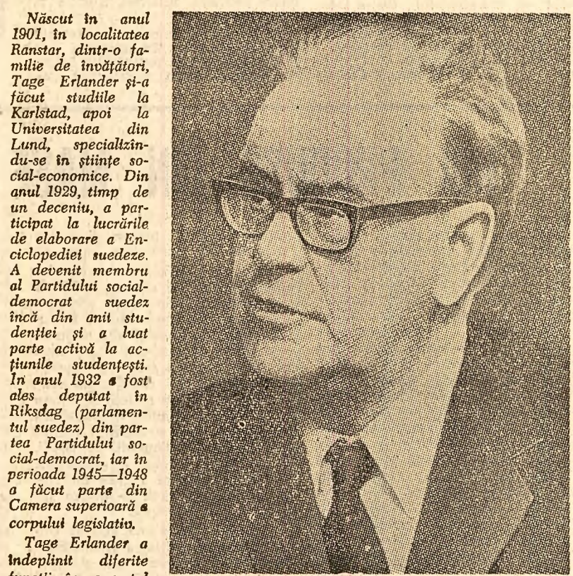
Născut în anul 1901, în localitatea Ranstar, dintr-o familie de învățători, Tage Erlander și-a făcut studiile la Karlstad, apoi la Universitatea din Lund, specializîndu-se în științe so- cial-economice. Din anul 1929, timp de un deceniu, a par- ticipat la lucrările de elaborare a En- ciclopediei suedeze. A devenit membru al Partidului social- democrat suedez încă din anul studen- tesc și a luat parte activă la ac- țunile studențești.

La invitația președintelui Consiliului de Miniștri al Republicii Socialiste România, Ion Gheorghe Maurer, astăzi sosește în București, într-o vizită oficială, primul ministru al Suediei, Tage Erlander, însoțit de ministrul afacerilor externe, Torsten Nilsson.