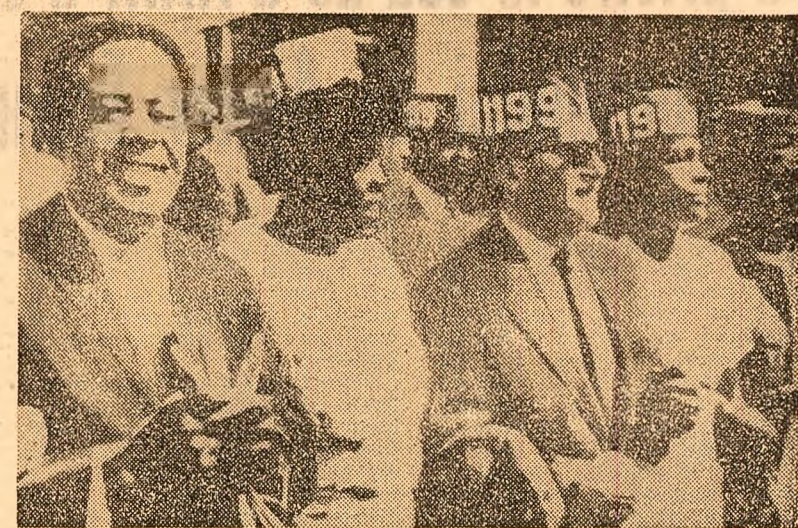
Ralph Abernathy, succesorul lui Martin Luther King la conducerea organizației negrilor din S.U.A., „Conferința conducerii creștine din sud”, a fost arestat vineri la Charleston, Carolina de sud. Au mai fost arestați 70 de lucrători ai spitalului din localitate, care participau la o demonstrație (în fotografie) cerînd autorităților aprobarea pentru crearea unui sindicat.