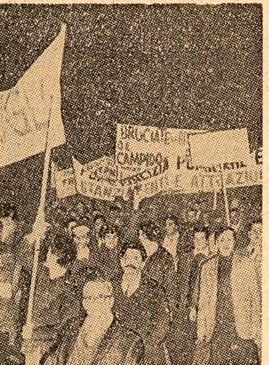
Locuitorii ai Romei demonstrează în sprijinul unor revendicări economice și reforme sociale

de Nord în vederea studierii condițiilor de navigație, precum și a obținerii unor date hidrologice, geografice, geofizice și meteorologice.