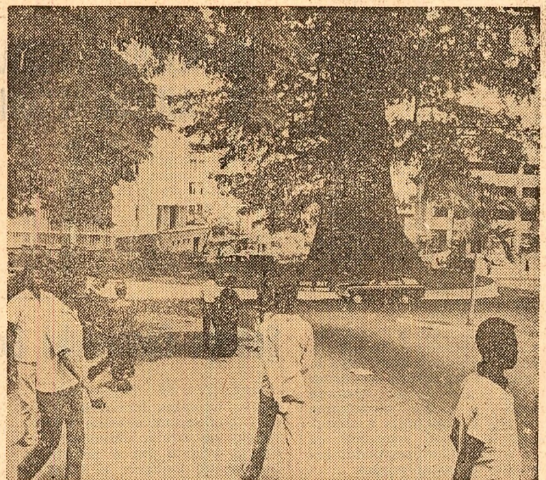
Astăzi poporul din Sierra Leone sărbătorește a opta aniversare a proclamării independenței. În fotografie: imagine din Freetown — capitala țării.