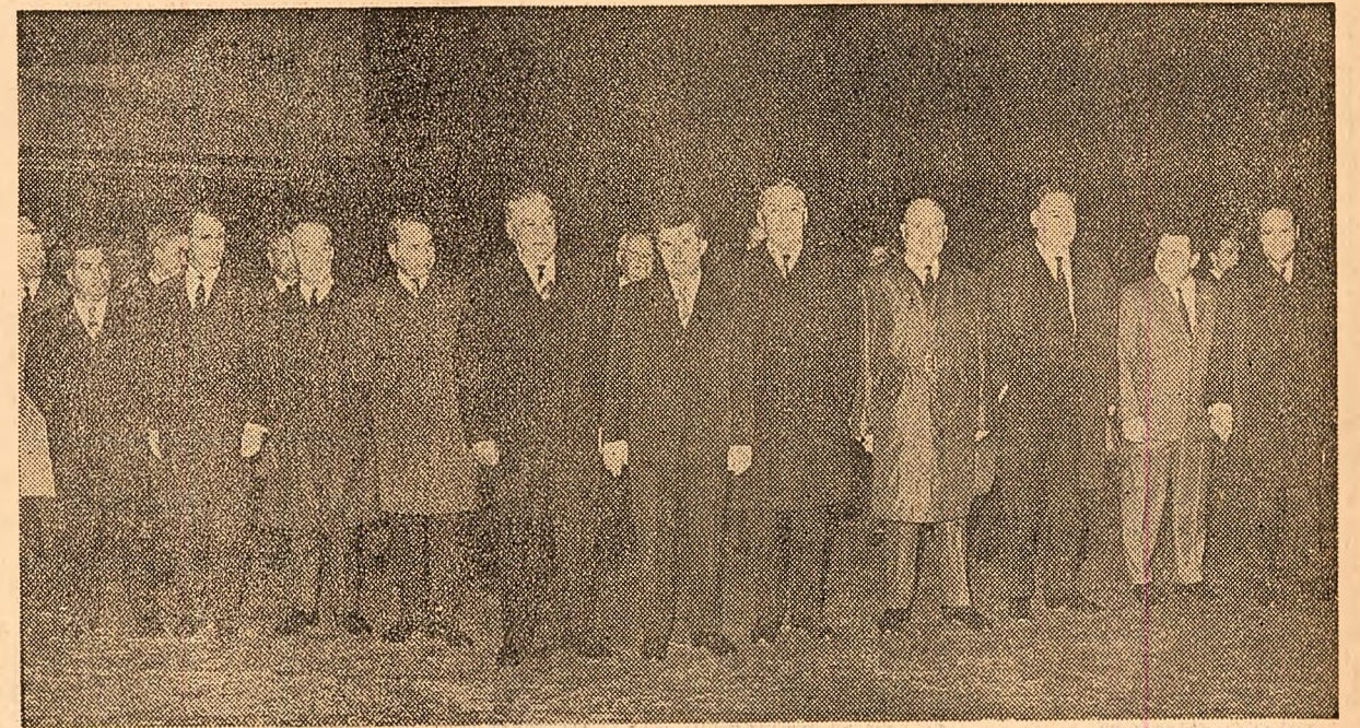
La sosire, pe aeroportul Băneasa