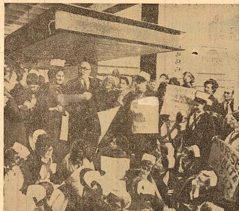
Londra. Manifestație a oamenilor muncii din domeniul sanitar în sprijinul unor revendicări economice și sociale

Unul dintre principalele obstacole îl constituie poli-