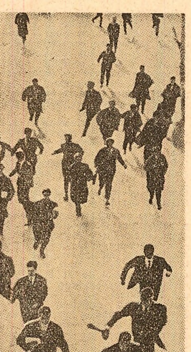
În timpul unei manifestații pe străzile orașului Madrid, împotriva prezenței bazelor militare ale S.U.A. pe teritoriul Spaniei