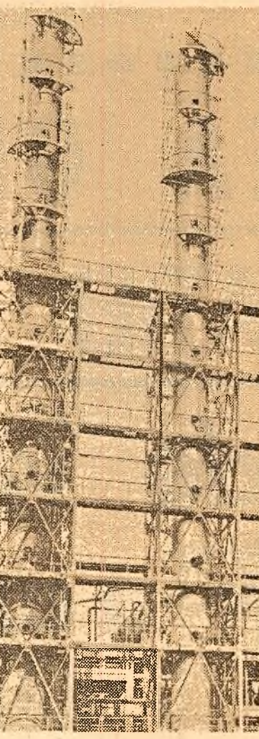
Secvență din largă panoramă a Rafinării din Pitești.