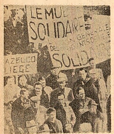
La Charleroi (Belgia) a avut loc recent o demonstrație a muncitorilor mineri care cereau oprirea concedierilor, renunțarea la închiriere în- terprenderilor, precum și îmbunătățirea condițiilor de muncă

Bilanțul oficial al tulburărilor din Malayașia a crescut în cursul nopții la 136 morți, prin descoperirea unor noi cadavre. Pînă în prezent, poliția a restat pe în- tregul teritoriul al țării 2.760 persoane. Duminică dimineață, forțele de poliție controlau situația la Kuala Lumpur. În cursul nopții s-a înregistrat doar un singur incident.