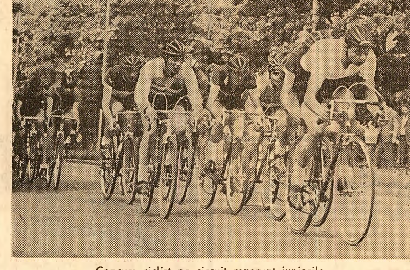
Concurs ciclist pe circuit rezervat juniorilor

În campionatul de rugbi, la București Steaua a învins cu 16-6 pe Grivița Roșie, iar Progresul a dispus cu 5-3 de Gloria. Alte rezultate, din țară: Ruimentul Birlad-Universitatea Timișoara 0-3; Agronomia Cluj-Politehnica Iași 3-3.