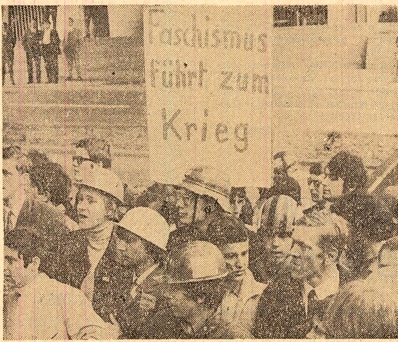
Cetățeni vest-germani demonstrînd împotriva congresului Partidului național-democrat, de orientare neozastistă, care a avut loc, recent, la Stuttgart