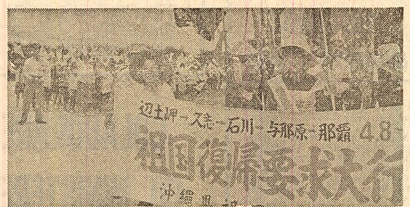
Japonia: Mii de locuitori ai insulei Okinawa au participat zilele trecute la marșul „Pentru întoarcerea la țara-mamă”

KHARTUM 25 (Agerpres). — În Sudan a avut loc duminică o lovitură de stat. Guvernul, condus de Mohammed Ahmed Mahgoub a fost răsturnat, iar puterea a fost preluată de Consiliul Comandamentului revoluției sudaneze, anunțând postul de radio Omdurman. Potrivit primelor știri sosește de la Khartum, lovitură de stat s-a produs fără incidente. Îndată după răsturnarea guvernului prezidat de Mahgoub, Consiliul a format un nou cabinet al cărui premier și ministru de externe este Abubakr Awadallah, președinte al Inaltei Curți de Justiție. Noul cabinet de la Khartum, menționează corespondentul agenției U.P.I., este alcătuit din militari și civili. Posturile cheie, portofoliul apărării și cel al afacerilor interne au fost atribuite colonelului Gaafar Mohamed el Moneiri și respectiv maiorului Larouk Osman Abdallah. Primul decret al noului guvern sudanez, dat publicității de postul de radio citat, anunță suspendarea temporară a constituției și a tuturor organizațiilor politice. Toate băncile din țară au fost închise pentru două zile, iar orice mitinguri și publicații cu caracter politic au fost interzise. Pe plan extern noile oficialități sudaneze s-au pronunțat pentru stringerea legăturilor dintre Sudan și celelalte țări ale lumii arabe.