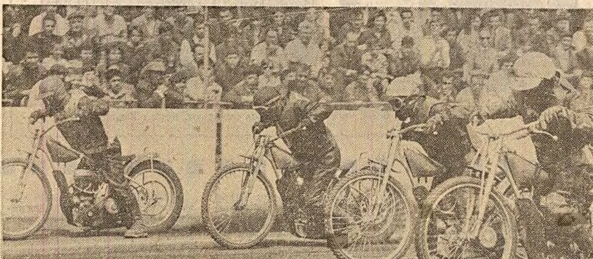
Bolizii s-au lansat în cursă I (Intrecerea internațională de dirt-track din Capitală)

BOX Se apropie campionatele europene CANOTAJ Succese ale sportivilor români la Heidelberg CICLISM Danguillaume (Franța) câștigător al „Cursei Păcii”