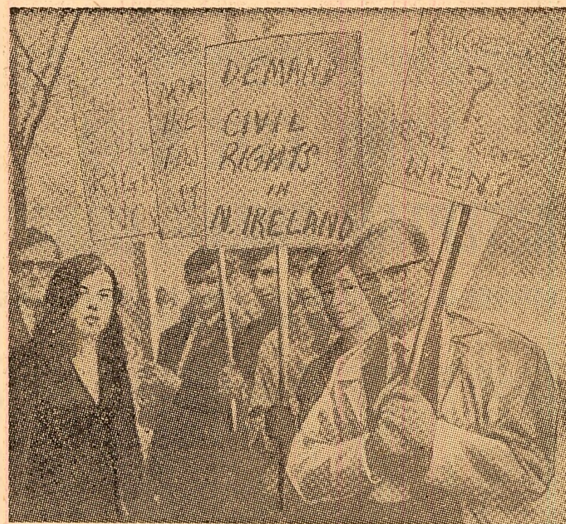
Demonstrație la Londra pentru acordarea de drepturi civile tuturor păturilor populației din Irlanda de nord

Reprezentantul administrației saigoneze, Pham Dang Lam, a repetat refuzul de a recunoaște dreptul legitim al F.N.E. de adevărat reprezentant al populației sud-vietnameze. Pe de altă parte, un purtător de cuvînt al Ministerului de externe de la Saigon a declarat joi că actuala administrație „nu va accepta niciodată formarea unui guvern de coaliție sau a unui cabinet de pace”, așa cum a propus Frontul Național de Eliberare.