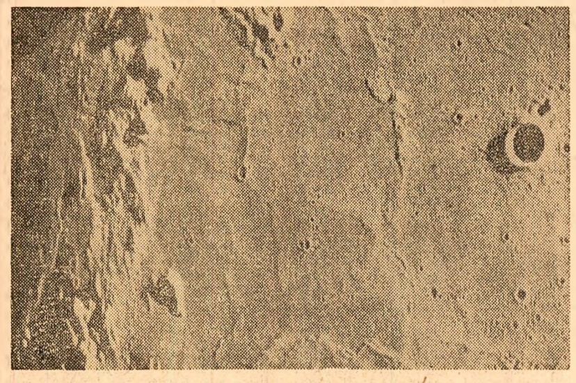
Administrația națională pentru problemele aeronauticii și cercetarea spațiului cosmic (NASA) a dat publicității primele fotografii și filme luate de astronautul Stafford, Cernan și Young în timpul zborului lor lunar la bordul navei spațiale „Apollo-10”. Cliseele prezintă aspecte ale reliefului din zona „Mării Liniștii”, unde urmează să aselenizeze astronauții navei „Apollo-11”.

Programul de acțiune pe perioada următoare a Consiliului General al Sindicatelor din Japonia a fost dat publicității la Tokio. Documentul stabilește obiectivele clasei muncitorești nipone în lupta pentru interesele vitale, împotriva politicii de alianță militară cu S.U.A., pentru abrogarea Tratatului de securitate japoano-american. Consiliul General al Sindicatelor subliniază necesitatea colaborării cu partidele comuniste, socialiste și Komito în cadrul acțiunilor împotriva capitalului monopolist.