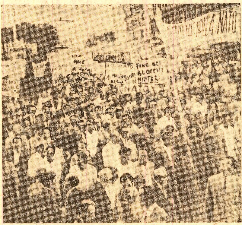
Italia. Aspect de la o recentă demonstrație a populației din Neapole împotriva N.A.T.O. și a bazelor militare străine de pe teritoriul țării