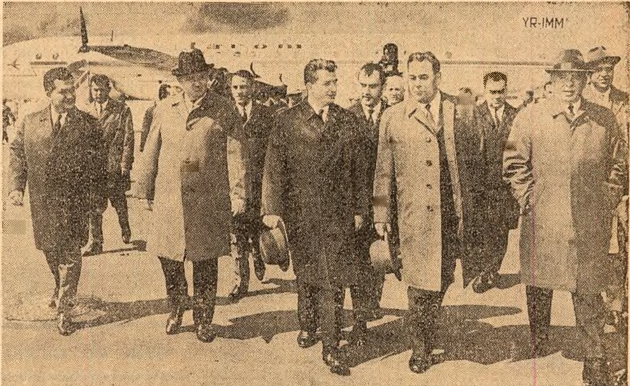
La sosire, pe aeroportul Vnukovo

Miercuri dimineața a părăsit Capitala delegația Partidului Comunist Român, condusă de tovarășul Nicolae Ceaușescu, secretar general al C.C. al P.C.R., care va participa la Consfătuirea internațională a partidelor comuniste și muncitorești de la Moscova.