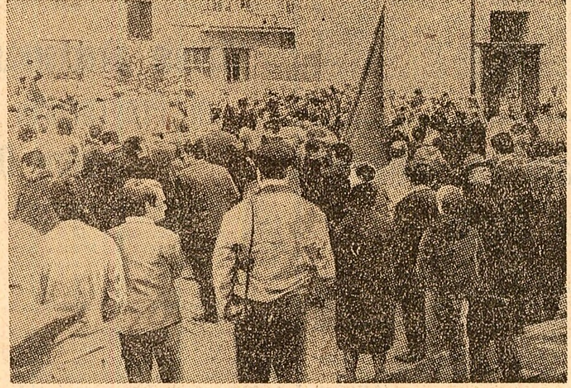
Hamburg (R.F. a Germaniei). Blocind străzile, o mare mulțime de oameni a împiedicat recent desfășurarea unui marș organizat de către secția locală a Partidului național-democrat, de orientare neonazistă