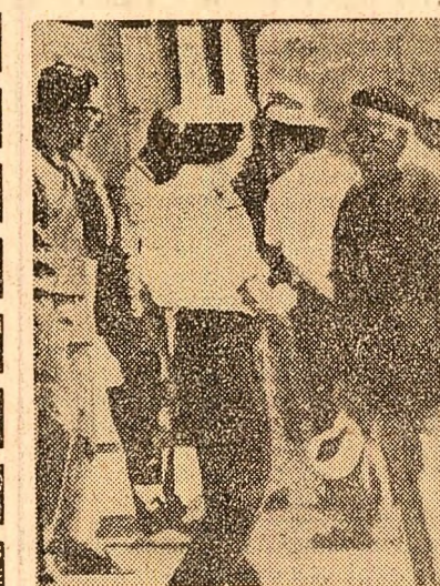
În urma hotărârii guvernului spaniol de a închide frontiera cu Gibraltarul, muncitorii spanioli care lucrau în această colonie engleză nu s-au putut duce la locurile de muncă. În fotografie: muncitorii spanioli opriți la un punct de trecere

Alekos Panagoulis, condamnat la moarte pentru tentativa de asasinare a primului ministru Georghios Papadopolous, a fost arestat într-un cartier din centrul capitalei grecești, a anunțat într-o conferință de presă S. Patakos, vicepremier și ministru de interne.