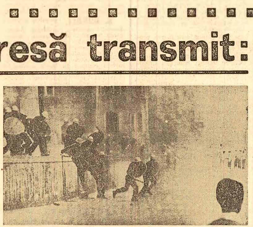
Pața clădirilor universitare din Istanbul, asigurată pînă acum de poliție, în urma incidentelor ce au avut loc între grupuri de studenți contestatari și forțele de ordine, a fost preluată de unități armate, care au fost înscrinate să asigure ordinea în interiorul universității din acest oraș. În fotografie: poliția împrăștiind o demonstrație studențească

Limita apelor teritoriale ale Canadei va fi extinsă, de la 11 iunie, de la 3 la 5 mile, a anunțat în Camera Comunelor ministrul afacerilor externe, Mitchell Sharp. În această zonă, Canada va poseda dreptul exclusiv de a pescui.