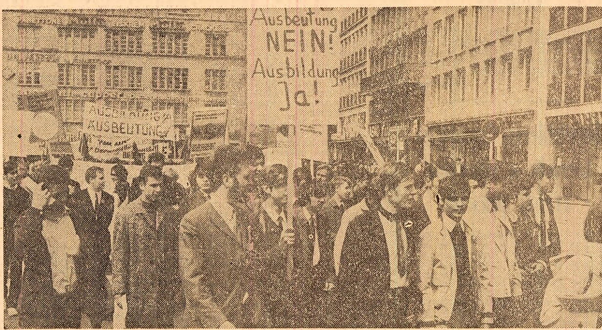
Peste 10000 de tineri muncitori și ucenici din Köln (R. F. a Germaniei) au organizat o demonstrație (în fotografie), cerind să li se dea posibilitatea unei mai bune pregătiri profesionale

SALISBURY 20 (Agerpres). — Vineri a început în Rhodesia referendumul asupra constituției, în cadrul căruia electoratul țării (alcatuit din albi în proporție de 80 la sută) urmează să răspundă prin „da” sau „nu” la două chestiuni: prima referitoare la proclamarea republicii, cea de-a doua, la aprobarea proiectului de constituție recent prezentat de guvernul lui Smith. Noua constituție, scrie în legătură cu aceasta corespondentul agenției France Presse, prelungeste pe o durată nedeterminată menținerea puterii de către minoritatea albă. Majoritatea copleșitoare a celor peste patru milioane de băștinasi zimbabwani nu au dreptul de a participa la referendum. În acest sens, este semnificativă relatarea lui Anthony White, co-