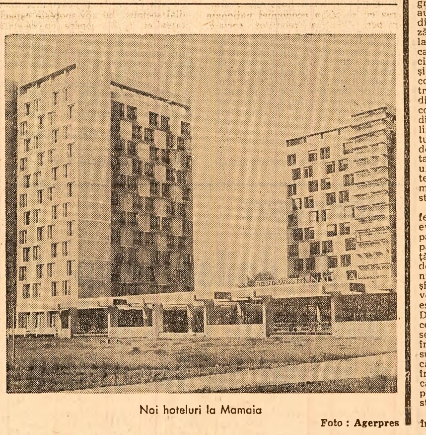
Noi hoteluri la Mamaia

vea să se desprindă de marfă. Dorește cu tot dinadinsul să o însoțească personal, din momentul în care a achitat-o pînă la ușa apartamentului”. „Intr-adevăr - au fînt să ne spună și doi reprezentanți ai conducerei Direcției generale a marilor magazine (forul tutelar al I.C.S. „Victoria”) - s-a creat la cumpărător o concepție greșită de înălțură”. Dar ce are de-a face cerința îndreptățită a oamenilor de a vedea cît mai repede în casă marfa cumpărată (și nu alt decît cea aleasă) cu defecțiunile organizatorice ale rețelei de desfacere? Cunoașteți oare vreun cumpărător a cărui dorință arzătoare este aceea de a-și căra televizorul sau frigiderul în brațe, pînă în stradă, de a-l lăsa în grija copilului pînă alergă după furgonată? Ori aceea de a fugi după instalatorul de antenă, după tehnicianul de televiziune, iar pentru cel mai mic serviciu să fie la cheremul „specialiștilor” care se arată dispuși să-l ajute? Situația este similară și la mobilă, iar urmarea - creșterea în jurul magazinelor, a unei zone largi de acțiune pentru „amatori” ce-și oferă în voie „o gamă variată de servicii” la prețuri piperate. Întrebăm: înaintea de a se spune „nu” a fost luată mîcar în discuție, modul serios, problema în întregul ei, spre a se vedea ce se poate face? Considerăm că ar fi util ca de pe acum să se aibă în vedere, pe baza unor prevederi concrete, modalitățile de colaborare a