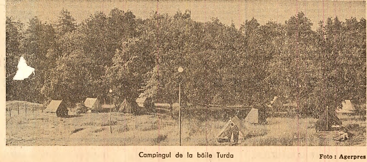
Campingul de la băile Turda

Primul secretar al C.C. al U.T.C. a evidențiat caracteristica reuniunii, reliefînd faptul că dominată a fost dorința unanimă de a promova înțelegerea, dialogul și buna cunoaștere ca o contribuție proprie a tineretului la asigurarea păcii pe continent, dorința de a întreprinde acțiuni comune pentru realizarea unui sistem colectiv de securitate pe continent.