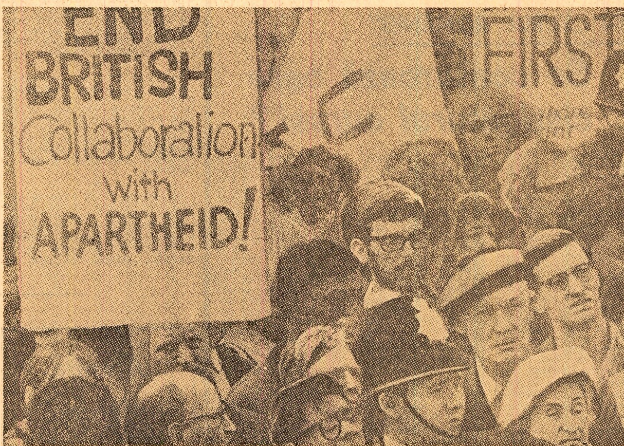
Imagine de la o recentă demonstrație organizată la Londra împotriva regimului de apartheid din Republica Sud-Africană

MONTEVIDEO 22 (Agerpres). — Trimisul special al președintelui S.U.A. în America Latină, guvernatorul Nelson Rockefeller, a părăsit duminică după-amiază Montevideo plecând în Statele Unite, după o vizită oficială de 24 de ore în Uruguay. Autoritățile uruguayene, relatează agențiile de presă, au mobilizat importante forțe polițienești pe aeroportul Carrasco, iar accesul publicului în raza aeroportului a fost interzis. Nelson Rockefeller s-a întâlnit simbolic seara cu președintele Uruguayului, Jorge Pacheco Areco, în stațiunea balneară Punta del Este, situată la 140 km de Montevideo. După cum au relatat agențiile de presă, trimisul special al președintelui S.U.A. în America Latină a fost întâmpinat în Uruguay de puternice demonstrații antiamericane.