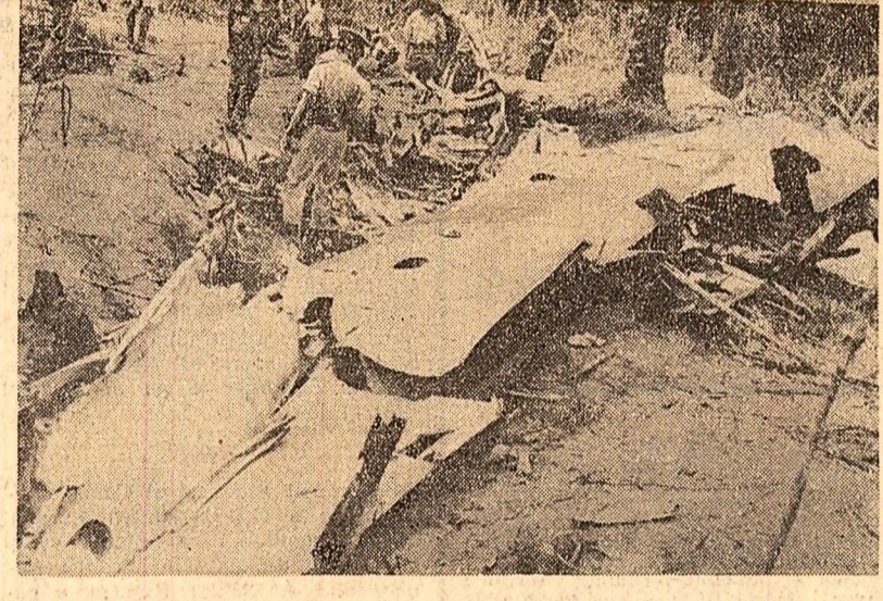
Doi divizi ale armatei federale nigeriene au lansat simultan în ultimele 24 de ore o puternică ofensivă asupra teritoriilor deținute de autoritățile bioafreze, a declarat sâmbătă în cadrul unei conferințe de presă comisarul federal pentru informații în guvernul de la Lagos, Anthony Enahoro. Ofensiva forțelor terestre este puternic sprijinită de aviația federală. El a precizat că această ocazie că trupele federale controlează malul drept al fluviului Niger și că unități ale diviziei a treia au cucerit suburbiile orașului Owerri, ultimul centru urban important controlat de trupele bioafreze. Declarațiile lui Enahoro, relevă agenția France Presse, sînt interpretate de observatorii militari de la Lagos drept un indiciu al unei ofensive generale pe care guvernul de la Lagos intenționează să o lanseze împotriva bioafreze în momentul în care au fost blocate toate canalele de aprovizionare cu alimente a populației din Biafra. În fotografie: un avion de luptă bioafreze doborât de artileria unităților federale.

La Brazzaville s-a încheiat lucrările unui seminar consacrat problemelor demografice și statistice sanitare din țările africane. Desfășurat sub auspiciile Organizației Mondiale a Sănătății, la seminar participau reprezentanți ai 20 de țări africane, observatori din partea Comisiei economice O.N.U. pentru Africa și altor organisme internaționale. Au fost examinate posibilitățile de îmbunătățire și extindere a cercetărilor demografice și a statisticii sanitare pe continentul african.