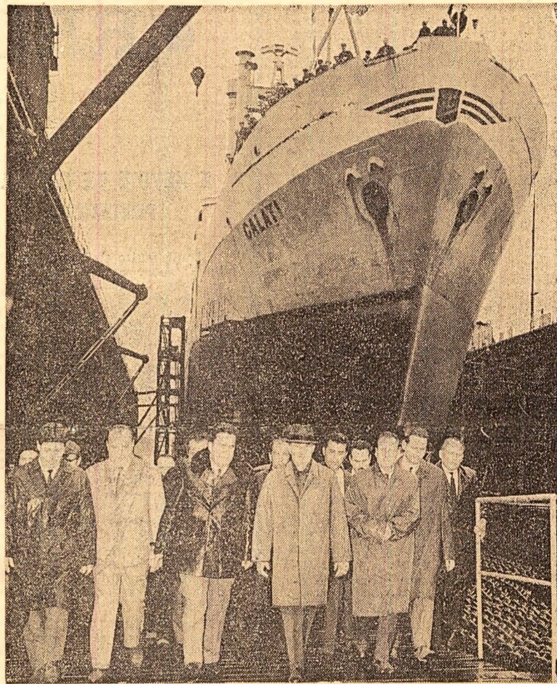
La șantiierul naval

Următorul popas: Casa pionierilor. Sunetele cristaline ale trompetelor vestesc sosirea oaspetelui