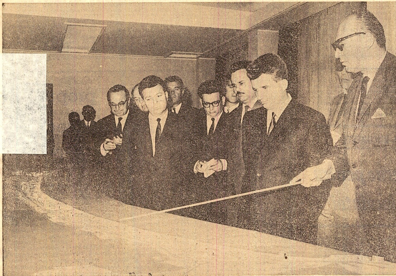
În fața machetelor se prefigurează dezvoltarea economică și edilitară a municipiului, perspectivele litoralului turistic