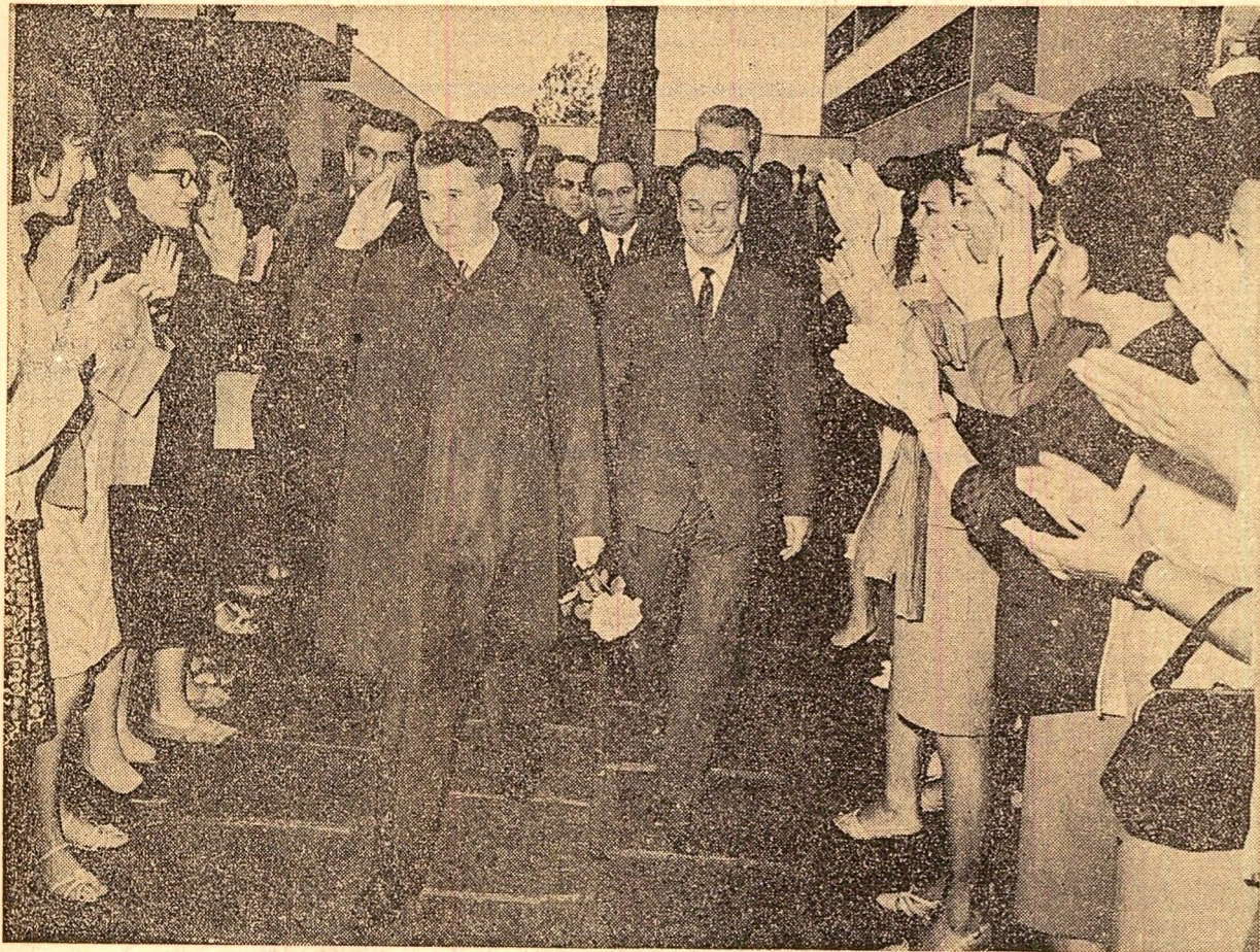
Cetățeni veniți la odihnă salută cu căldură pe tovarășul Nicolae Ceaușescu