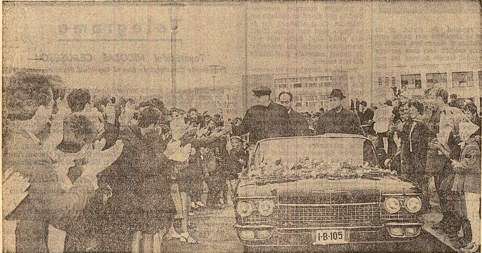
Ovații nesfârșite și flori — semne ale dragostei calde și prețurii

În manifestările pe care le-a prilejuit această vizită în județul și municipiul Cluj s-a reflectat vibrant marea dragoste, unită cu respect și prețuire, pe care întregul nostru popor o nutrește față de partidul comunistilor și conducerea sa, față de secretarul general al C.C. al P.C.R., tovarășul Nicolae Ceaușescu.