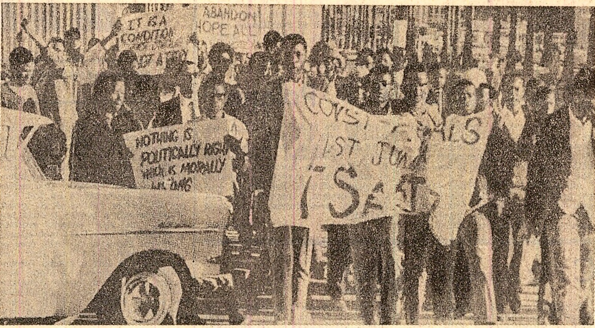
Demonstrație la Salisbury împotriva apartheidului. Ea a avut loc cu prilejul „celor mai triste zile” a Rhodesiei, cea a referendumului organizat de autoritățile rasiste.

PARIS 12 (Agerpres). — Delegația Guvernului Revoluționar Provizoriu al Republicii Vietnamului de sud la conferința de la Paris asupra Vietnamului a dat publicității vineri un comunicat, prin care respinge cu hotărâre intenția Administrației de la Saigon de a organiza alegeri generale sub controlul actualului regim sud-vietnamez. Comunicatul prezintă poziția guvernului revoluționar provizoriu, potrivit căreia „modelul cel mai realist, care va garanta alegeri cu adevărat libere și democratice și va permite populației sud-vietnameze să se bucure din plin de dreptul său la autodeterminare, este inițierea unei consultări cu toate forțele politice, reprezentând toate păturile populare și toate tendințele politice din Vietnamul de sud ce se pronunță pentru pace, independență și neutralitate. În vederea formării unui guvern de coaliție provizoriu, pe principiul egalității, democrației și respectului reciproc”. Numai un asemenea guvern de coaliție provizoriu va putea organiza alegeri generale.