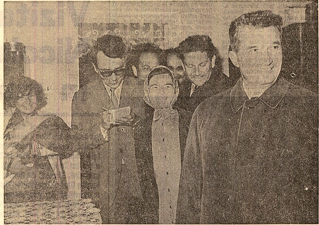
Cu inimă plină de bucurie, familia timplarului Emil Cotu primește în locuința sa pe oaspetele iubit

Înainte de a-și lua rămas bun de la gazde, tovarășul Nicolae Ceaușescu scrie în cartea de onoare a institutului: „Felicităm călduros întregul colectiv al institutului pentru activitatea sa rodnică, pentru