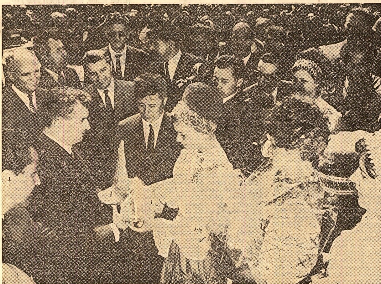
Înalții oaspeți primesc omagii simple, emoționant, pornii din adincul inimii, al locuitorilor din Carei

Tovarășul Nicolae Ceaușescu, secretarul general al Comitetului Central al Partidului Comunist Român, președintele Consiliului de Stat, a continuat luni, în județele Satu Mare și Bihor, vizita de lucru pe care o întreprinde în țară. La vizită participă tovarășii Maxim Berghianu, membru al Comitetului Executiv al C.C. al P.C.R., președintele Comitetului de Stat al Planificării, și Iosif Banc, membru supleant al Comitetului Executiv al C.C. al P.C.R., vicepreședinte al Consiliului de Miniștri. Vizita a prilejuit, în continuare, întalniri cu oameni ai muncii din industrie, din agricultură și din alte domenii de activitate, cu cadre de conducere, infor-