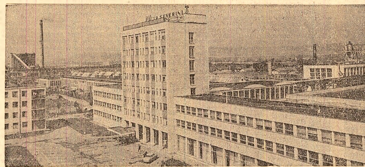
Combinatul de industrializare a lemnului din Turnu Severin