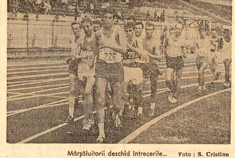
Mășalului deschid întrecerile...

Citeva dintre rezultatele finale ale primei zile de concurs: Masculin: 110 m garduri: Petrea (România) — 14"; 1500 m: Jipcho (Kenya) — 3'48"/10; 10000 m: Warner (Elveția) — 29'44"/10; înălțime: Mavrec (Cehoslovacia) — 2,05 m; triplu salt: Bessonov (U.R.S.S.) — 16,28; Feminin: 100 m garduri: Valeria Butanu (România) — 13'9"/10; 800 m: Ileana Silai (România) — 2'05"/10; lungime: Eva Kuckmanova (Cehoslovacia) — 6,11 m; disc: Lia Manoliu (România) — 57,12 m.