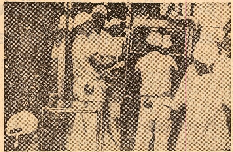
HOUSTON. — O primă operație: sterilizarea conținutului cu rocile lunare

• Eșantioanele lunare răspund primelor teste