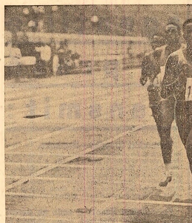
Trei din îndepărtata Kenye — Onko, Bon, Saisi — eroii de la 800 metri plat.

Urmare din pag. 1 flectă în rolul crescând care revine în întreaga viață a țării, în înfăptuirea politicii partidului — organizațiilor de masă și obștești, uniunilor cooperatiste și uniunilor de creație, ale căror atribuții s-au lărgit considerabil în ultimii ani. Prin crearea Frontului Unității Socialiste — organism politic reprezentativ, cu activitate permanentă, care unește, sub conducerea partidului, toate forțele sociale din țara noastră — a fost asigurat un cadru propice participării active a organizațiilor de masă și obștești, a tuturor oamenilor muncii la dezbaterile și aplicarea măsurilor inițiate de partid, la înfăptuirea programului de dezvoltare a construcției socialiste. Adeziunea entuziastă, deplină, exprimată de Uniunea Generală a Sindicatelor, Uniunea Tineretului Comunist, Consiliul Național al Femeilor, Uniunea Scriitorilor, de celelalte organizații de masă și obștești, de consiliile naționalelor comunități față de documentele pregătitoare ale Congresului al X-lea al P.C.R., constituie o înflăcărătoare și sprijinătoare al întregului popor față de politica marxist-leninistă a partidului.