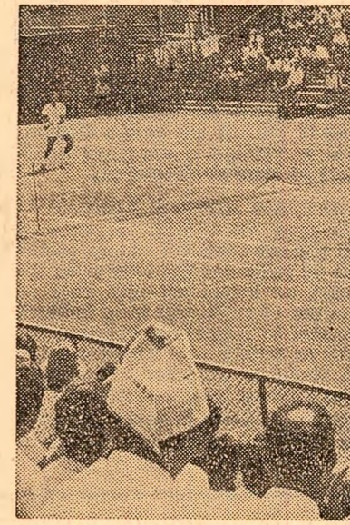
Fază din întâlnirea Ion Tiriac - Premijit Lal