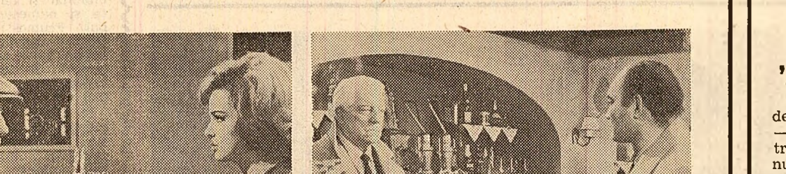
O coproducție franco-italiană. Interpretate de: Jean Gabin, Susanne Flon, Robert Stock, Margareth Lee. Scenariu