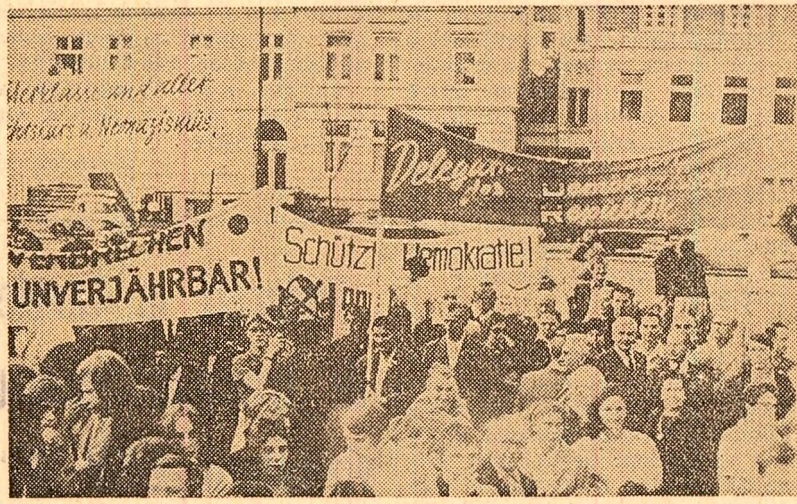
Miting de protest la Hamburg împotriva activității Partidului național democrat, de orientare neozaristă

PRAGA 30 (Agerpres). — Secretariatul Uniunii Internaționale a Studenților a dat publicității o declarație în legătură cu împlinirea de 30 de ani de la începerea celui de-al doilea război mondial. U.I.S. cheamă întreaga studenție progresistă să intensifice lupta împotriva forțelor reacțiunii, imperialismului, militarismului și neozarismului, împotriva politicii de dezlănțuire a unor noi războaie, pentru o pace trainică și progres social.