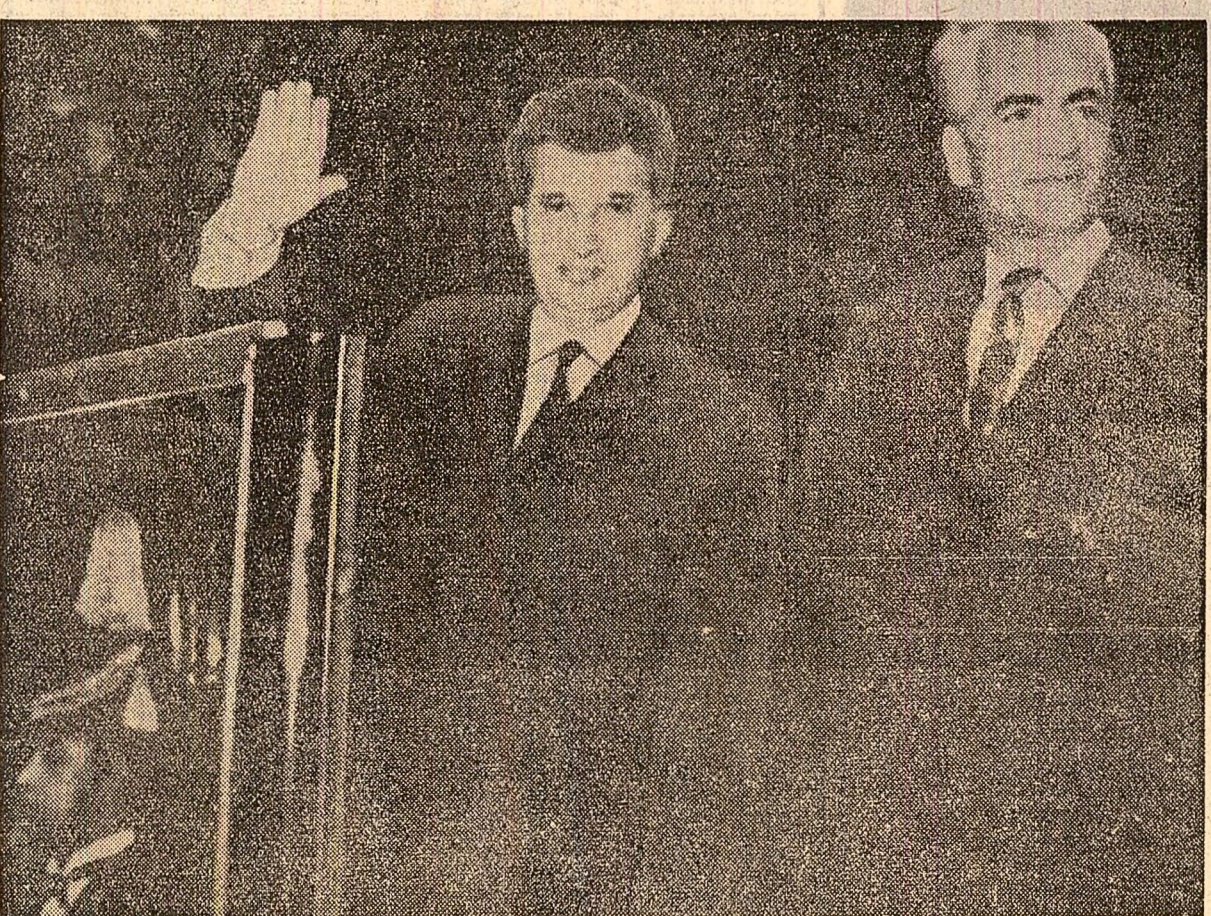
După sosirea la Teheran, în mașina deschisă, salutînd locuitorii veniți în întâmpinare.

Teheran, „orașul cald” în limba persană, și-a justificat ieri pe deplin numele. Căldura cu care a fost întâmpinat președintele Consiliului de Stat al Republicii Socialiste România, tovarășul Nicolae Ceaușescu, a făcut ca străvechea capitală a Iranului să ne apară ca un oraș al simbetului cald, al bucuriei și prieteniei. Sutele de mii de oameni care au ieșit pe străzi agițînd stegulețele românești și iraniene, furtuna de aclamații cu care au întâmpinat trecerea iluztrului oaspete și a Maiestății Sale Imperiale Șahinșahului Mohammad Reza Pahlavi Aryamehr, miile de portrete ale to- varășului Ceaușescu și ale soției sale care au împodobit zidurile caselor, vitrinele, pietele, marile drapele roșu-galben-albastru au lăsat asupra noastră o impresie copioasă. Zeci de minute am străbătut marile bulevarde Reza Sah și Ferdous print-o mare de oameni care strigau „DJAVID CEAUȘESCU” („Trăiască Ceaușescu”), „DJAVID SAH”, „IRAN DUSTR-E-ROMANI”, („Iranul și România sînt prietene”). Era un singur glas de fapt: glasul unui popor care manifesta pentru pace și (Continuare în pag. a III-a)