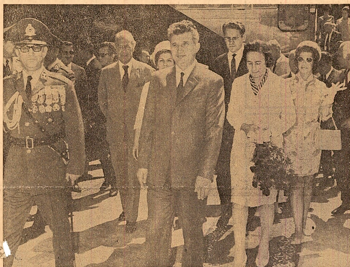
Sosirea la Persepolis

Mesajul de pace și colaborare adus poporului iranian