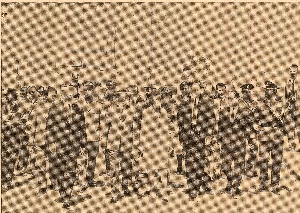
La Persepolis — carte de istorie, scrisă în piatră