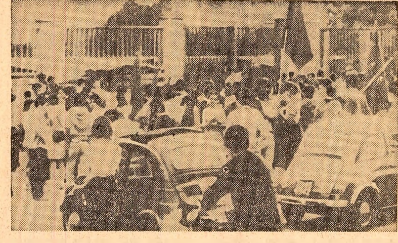
Muncitori greviști de la firma Fiat din Torino protestînd împotriva hotărîrii companiei de a închide una din liniile de asamblare ale uzinei. Măsura a lăsat fără lucru circa 14 000 de persoane

Ministrul afacerilor externe al R. F. a Germaniei, Willy Brandt, care a făcut miercuri o scurtă vizită la Bruxelles, a avut convorbiri cu ministrul de externe belgian, Pierre Harmel, cu care a examinat probleme privind viitorul Pieței comune și, îndeosebi, largirea acesteia organizației economice vest-europene. Cei doi miniștri au căzut de acord asupra convocării unei conferințe la nivel înalt a celor șase țări membre ale Pieței comune, care să examineze cererea Marii Britanii de a adera la Piața comună.