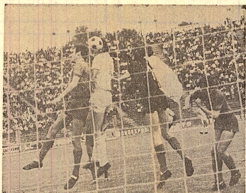
Golul al doilea al dinamoviștilor: o fază etalon pentru dirzenia care a caracterizat disputa celor două formații.