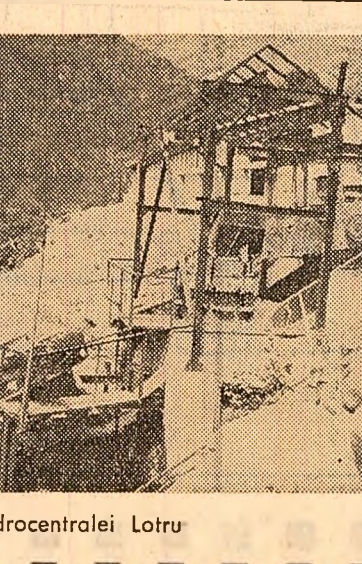
O stație modernă, de mare randament, de sortare și preparare a betoanelor pe șantierul hidrocentralei Lotru

Acțiunea de propagandă tehnico-științifică „Orizont tehnic Suceava '69”, inițiată de Consiliul județean al sindicatelor și Cabinetul pentru probleme de organizare a producției și a muncii din Suceava, continuă pe un plan superior o serie de manifestări pentru generalizarea experienței înaintate din marile unități economice. Sub forma unor conferințe, dezbateri, mese rotunde, simpozioane se va realiza un amplu dialog între specialiștii și muncitorii pe cele mai actuale teme de organizare științifică a producției și a muncii.