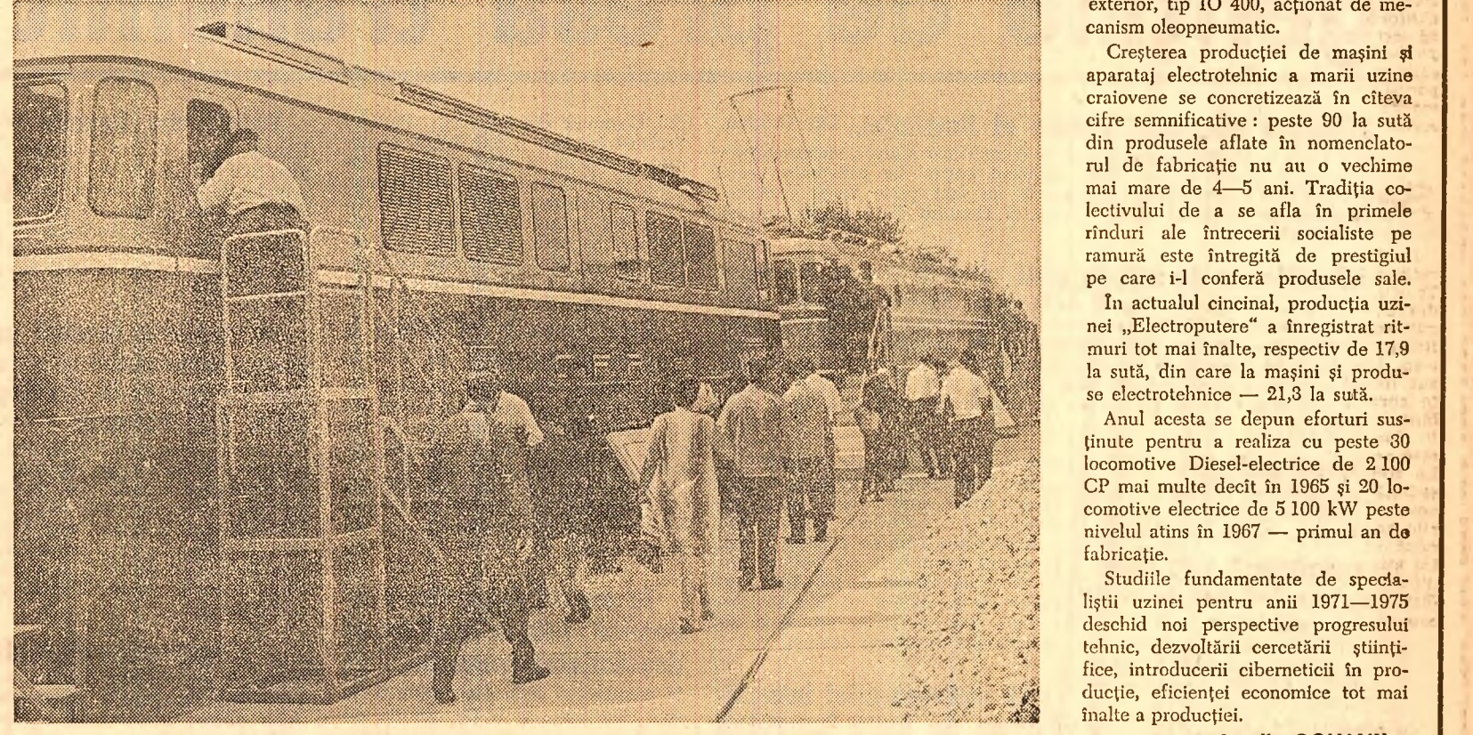
Locomotivă Diesel-electrică de 2100 CP și locomotivă electrică de 5100 kW (6.580 CP) Foto: M. Andreescu (Reportaj publicitar)

Nu întîmplător, la marea expoziție deschisă în aceste zile în Capitală, marca „Electroputere” aduce cu ea aici, ca și peste hotare, mesajul inventivității și inteligenței tehnice românești. Realizările acestei uzine s-au obținut din împletirea fabricației locomotivelor Diesel-electrice și