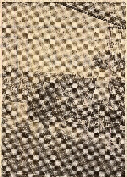
Gol 1:2:0 în partida Rapid - C.F.R.-Cluj