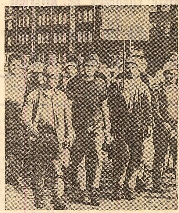
Demonstrație a muncitorilor din Dortmund-R.F.G., pentru condiții mai bune de muncă și salarizare

După cum s-a arătat în Comunicatul comun dat publicității la încheierea întâlnirii de la Porțile de Fier, pe lângă vizitarea construcțiilor hidrocentralei, cei doi conducători de partid și de stat, împreună cu colaboratorii lor, au procedat, într-o atmosferă de prietenie și deplină încredere reciprocă, la un schimb de păreri asupra relațiilor bilaterale și asupra unor probleme actuale ale situației internaționale și ale mișcărilor muncitorești internaționale și s-au informat reciproc cu privire la mersul construcției socialiste din cele două țări. Comunicatul evidențiază ca un aspect deosebit de important hotărîrea celor două țări de a extinde în continuare colaborarea pe diverse planuri - politic, economic, tehnico-științific etc. Astfel, s-a convenit să se realizeze în continuare proiectele de cooperări în producția industrială, în vederea unei mai bune valorificări a posibilităților economice reciproce. Pentru aplicarea acestor proiecte, s-a decis să se realizeze un schimb reciproc de informații și experiențe în domeniul științific și tehnico-științific și să se realizeze în continuare proiectele de cooperări în producția industrială, în vederea unei mai bune valorificări a posibilităților economice reciproce.