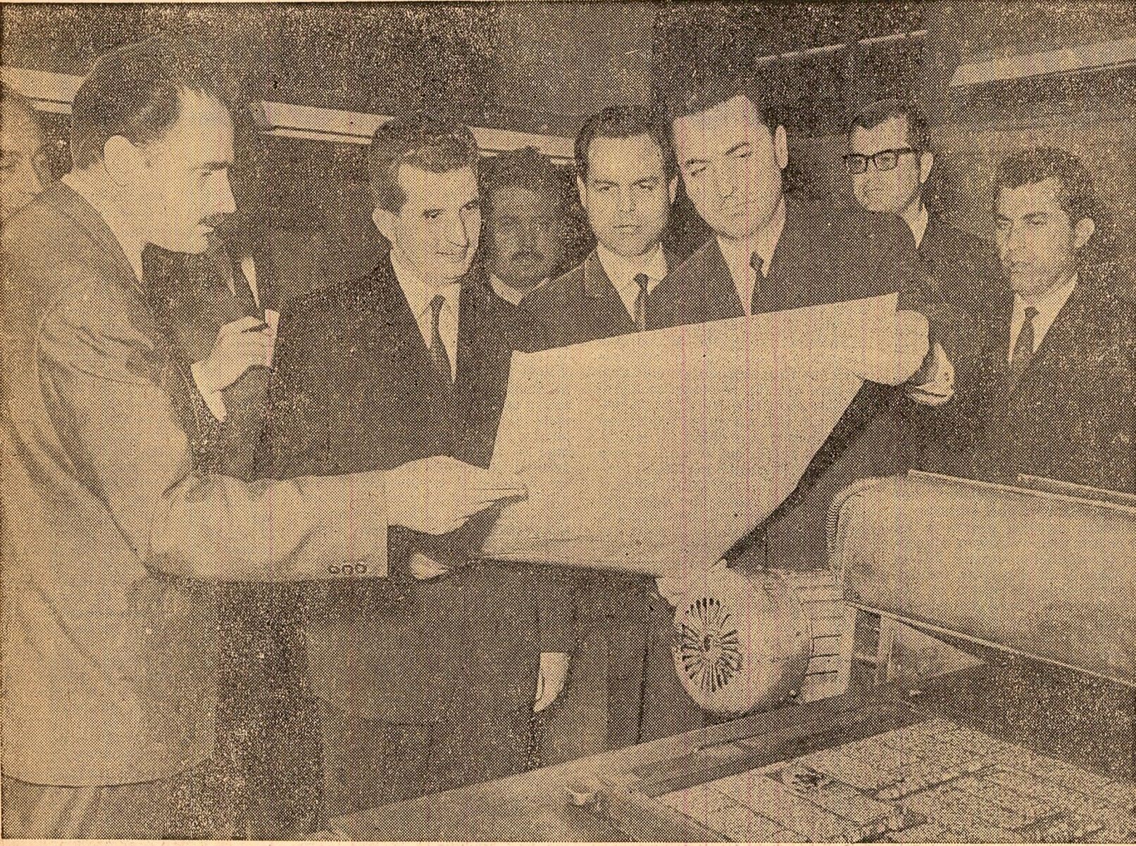
Intr-una din seciile Combinatului Poligrafic „Casa „Scintei”