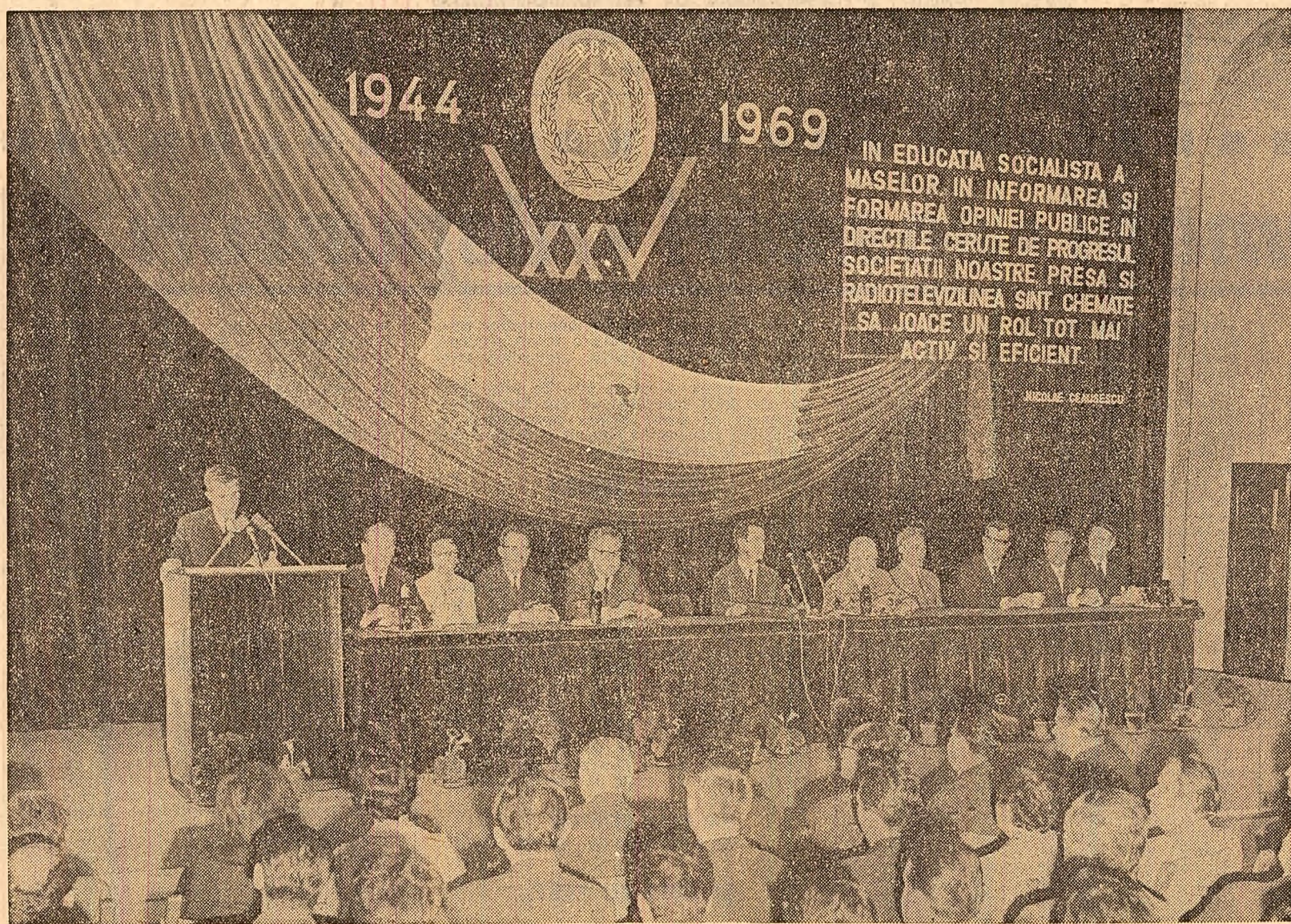
În timpul adunării festive

EDUARDO FREI Președintele Republicii Chile