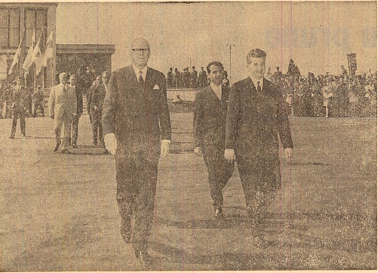
La plecare, pe aeroportul Băneasa