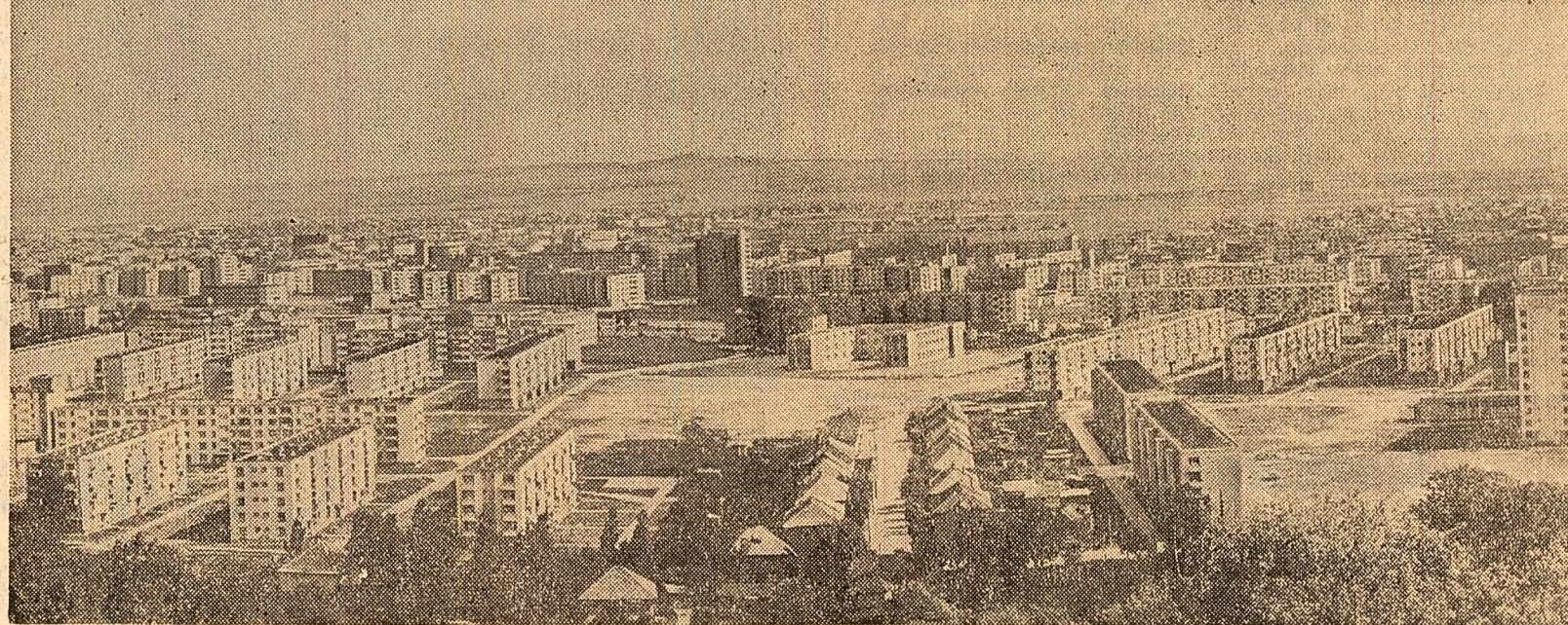
Orașul Baia Mare, astăzi