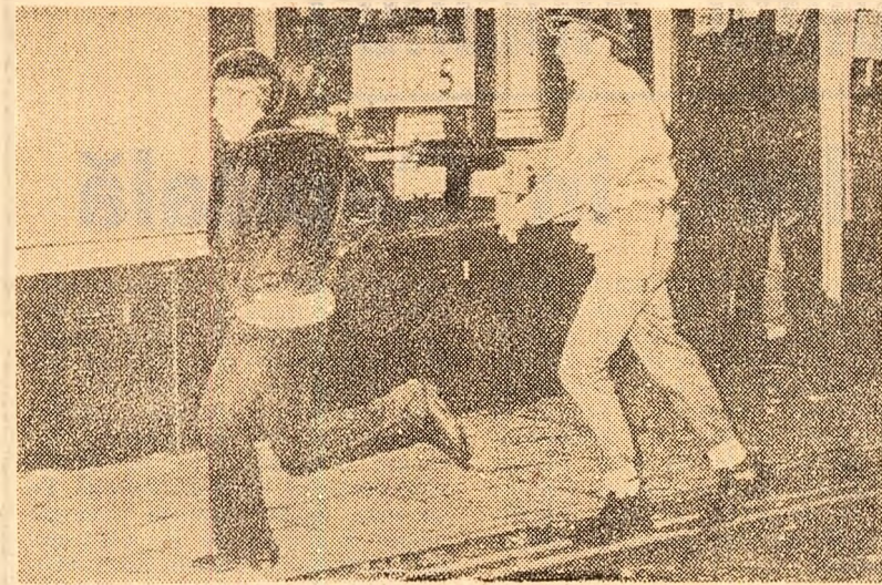
Trupele britanice dislocate la Londonderry au fost nevoite să intervină din nou joi seara pentru a împiedica grupuri de tineri catolici să intre în cartierul protestant al orașului. Manifestanții au atacat cu pietre mașinile poliției nord-irlandeze. Pentru evitarea unor noi incidente, soldații britanici au format un cordon între manifestanții și unitățile poliției nord-irlandeze. Cu toate că, în cursul nopții demonstrații s-au împiedicat, tensiunea continuă să domnească între cele două comunități, în urma incidentelor care au avut loc cu o noapte în urmă, soldatele cu o murt și mai mulți răniți. În fotografie: în timpul tulburărilor de la Londonderry

BONN 26 (Agerpres). — Hotărîrea guvernului vest-german de a închide toate bursele de devize din țara țării după alegerile legislative, care au loc duminică, a fost urmată de măsuri similare în mai multe țări vest-europene, care au suspendat începînd de joi orice operațiuni cu marca vest-germană. Această măsură a fost luată în Elveția, Italia, Austria, Norvegia, Danemarca. Ministrul francez al economiei și finanțelor, Valery Giscard d'Estaing, a anunțat că bursele de devize din Franța nu vor fi închise. Cu acest prilej, el a calificat măsura guvernului vest-german drept „prudentă și înțeleaptă”. În Spania operațiunile cu marca nu au fost suspendate, dar, după cum au arătat oficialitățile, această măsură va putea fi luată din clipa în care se va dovedi necesară. Se consideră totuși că închiderea bursei de devize vest-germane nu putea rezolva problemele financiare și economice existente în R. F. a Germaniei și că, o dată cu redeschiderea lor, „s-ar putea deschide și calea spre noi probleme”.