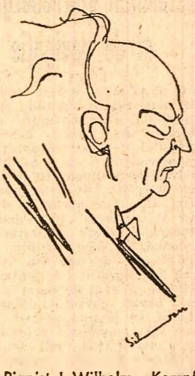
Pianistul Wilhelm Kempff (Desen de SILVAN)

parent inexplicabile de mare surprinzătoare suspensuri, pedalezarea unor irizații, întretăiații cînt și cînt de accentuate bruscate, nu pot fi desprinse din acest viu organism de artă autentică pe care o reprezintă interpretările sale. Iar a-lătură de emoția lăuntrică, frumusețea sonoră de o consistență și o strălucire ascunsă — bucuria înseși a plăsmuirii și încheierii sunetelor — cunoaște Kempff un adevărat cult fenomenului muzical. Și de faptei alți de diferite cum sînt fuga în re minor sau Variațiunile „Goldberg” de o complexă construcție polifonică, de Bach sau a-vintului concert de Schumann, Kempff găsește preluarea virtuții romantice în „șesătura contrapunctică a variațiilor remarcabile în simfonie de Schumanniană temă populară din final, dar știe și să construiască ponderat în substanța muzicală tipic romantică a opusului schumannian. Și, dacă ascultîndu-l interpretînd celebra Siciliana sau Corali din Camerata nr. 147 de Bach, rămînem totuși atinși viziv de un calm olimpic în tălmăcirea de Lipatti, nu putem să nu admirăm în continuare acest exemplu de aleasă dăruire de sine pe care ni-l oferă un mare artist contemporan. Dumitru AVAKIAN