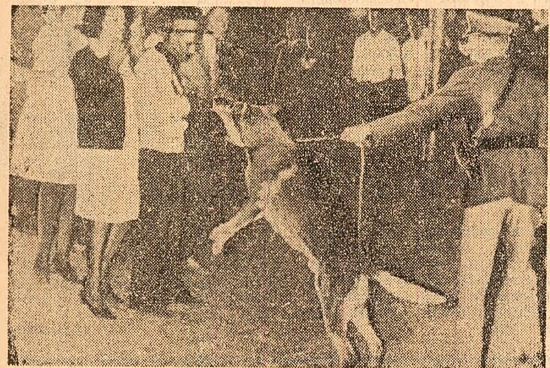
În cursul alegerilor care au avut loc la Johannesburg (Republica Sud-Africană) pentru aosa-numitul „Consiliu al metelilor”, poliția regelului rasist a folosit foaie mijlocelor pentru a împiedica populația de culoare să-și exprime voința.

TEL AVIV. — Un purtător de cuvînt militar israelian a anunțat că a avut loc în nordul Peninsulei Sinai, declarînd, potrivit agenției U.P.I., că a fost bombardată o „zonă pustie” la 101 kilometri de Canalul de Suez.