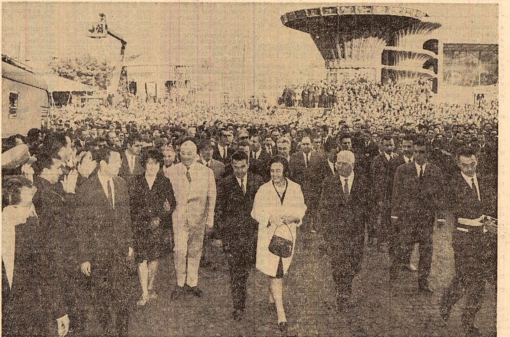
Cetățenii Capitalei prezenți la sărbătoarea îi aclamă pe conducătorii partidului și statului

Comarna, „Ziua recoltei” a prilejuit și înmînarea diplomelor de unități frunțoase la cultura grîului 1969 cu cooperativele din comunele Băltăți, Ruginoasa și Brătulești.