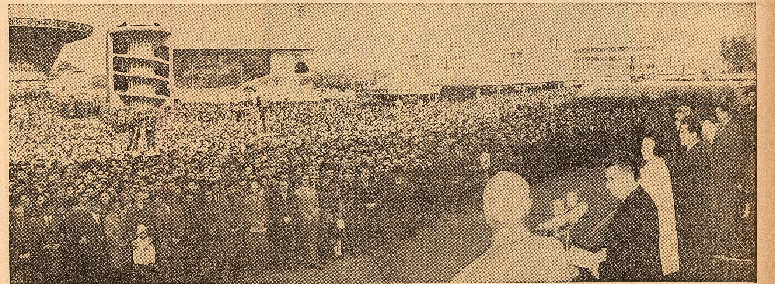
În timpul marii adunări populare din piața Obor.