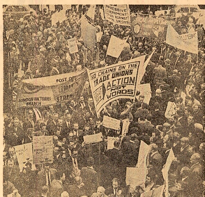
London. Imagine de la o recentă demonstrație de protest organizată de muncitorii englezi împotriva creșterii prețurilor, a măsurilor restrictive din domeniul salariilor, pentru respectarea dreptului la grevă

● O CUVINTARE A PREȘEDINTELUI MAKARIOS NICOSIA 5 (Agerpres). — Președintele Republicii Cipru, arhiepiscopul Makarios, a respins, într-o cuvintare rostită sîmbătă seară, propunerile formulate de reprezentanții comunității turce la negocierile intercomunitare în curs, consacrate problemei administrative locale. Președintele a motivat această hotărîre prin faptul că acceptarea propunerilor respective ar duce la o împărțire geografică a insulei și la o ruptură politică între comunitățile greacă și turcă. Makarios a arătat în cuvintare că negocierile intercomunitare sînt pe punctul de a se întrerupe.