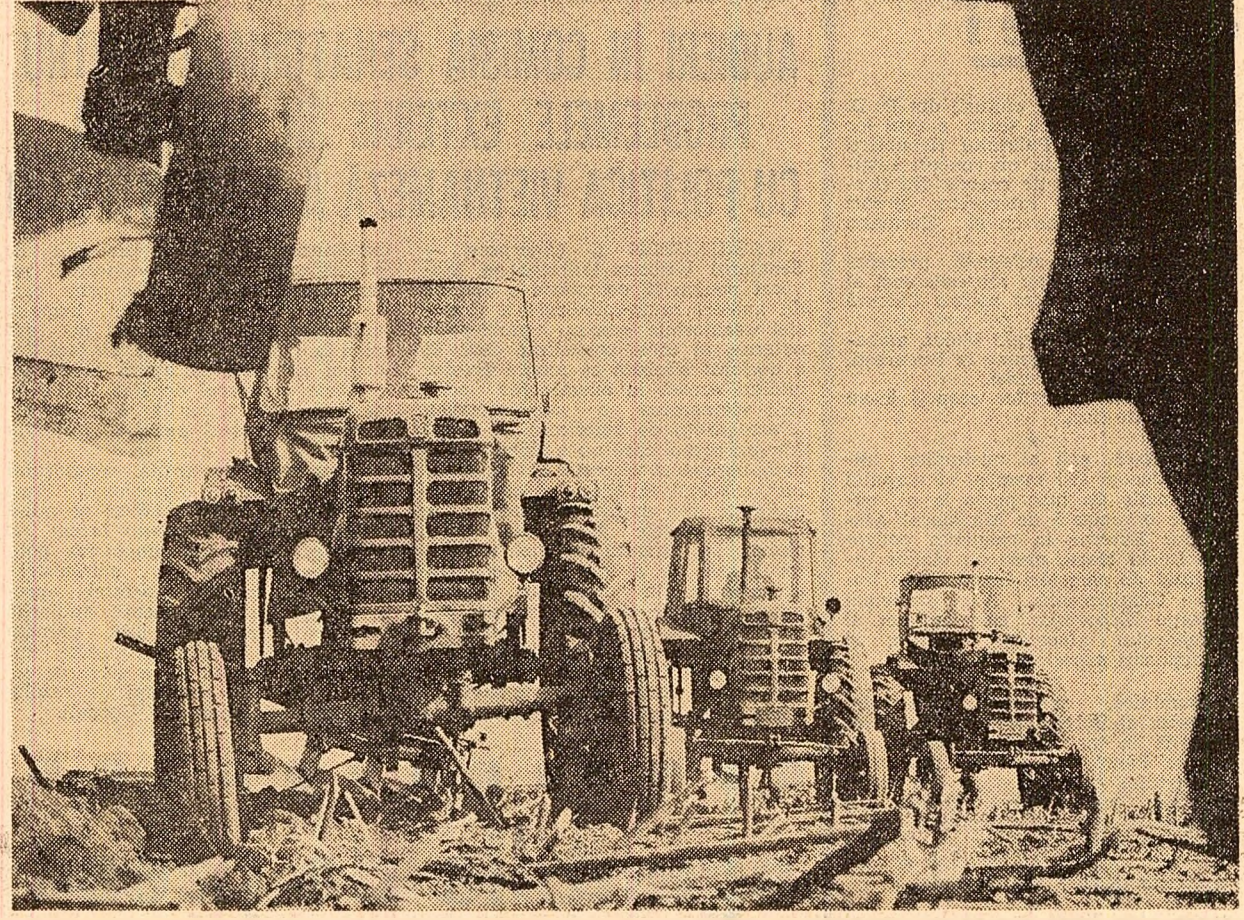
Duminică, inecanizatorii de la ferma nr. 6 a I.A.S. Urleasca, județul Braiila, au lucrat din pînă. Cu ajutorul a 9 tractoare s-au pregătit 60 ha teren

Exact în zorii zilei, cînd în Piața Cipariu din Cluj, în piețele din municipiile Turda, Dej și celelalte orașe ale județului un număr însemnat de cooperative agricole își expuneau spre vinzare produsele pentru a contribui la buna aprovizionare pentru țară, plecau spre cîmpurile cu porumb și sticla din afara orașelor, sute și sute de muncitori din fabrici și uzine, tineri, elevi, studenți pentru a da o mîna de ajutor cooperativelor la stringerea porumbului. De fapt, aproape peste tot sărbătorirea recoltei a fost transformată într-o sărbătoare a muncii. În cele mai multe părți s-a arat, s-a semănat, s-a recoltat sticla de zahăr, porumb, fructe și alte produse. La cooperativa agricolă de producție din Someșeni, toate tractoarele erau la arat și semănat, iar cooperatorii, împreună cu un grup numeros de elevi ai școlii profesionale auto, recoltau porumbul. În același timp, numeroase camioane transportau sticla la baza de recepție. La Iclod, de asemenea, se lucra intens atît la recoltatul porumbului, cît și la semănat, lucrări care aici sînt destul de avansate. Cooperativa agricolă de producție din Geaca a primit un