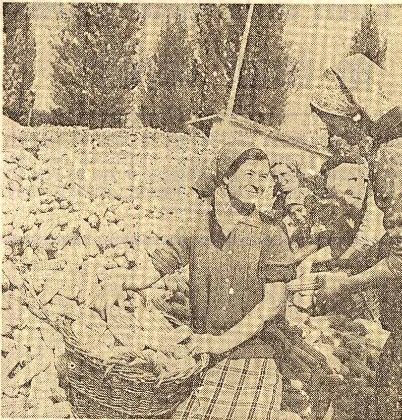
În aceste zile de toamnă, în care hărnicia omului este răsplătită din plin, membrii brigozilor de cimp ale cooperativei agricole de producție din comuna Gîrbovii, județul Ilfov, lucrează la culesul porumbului...