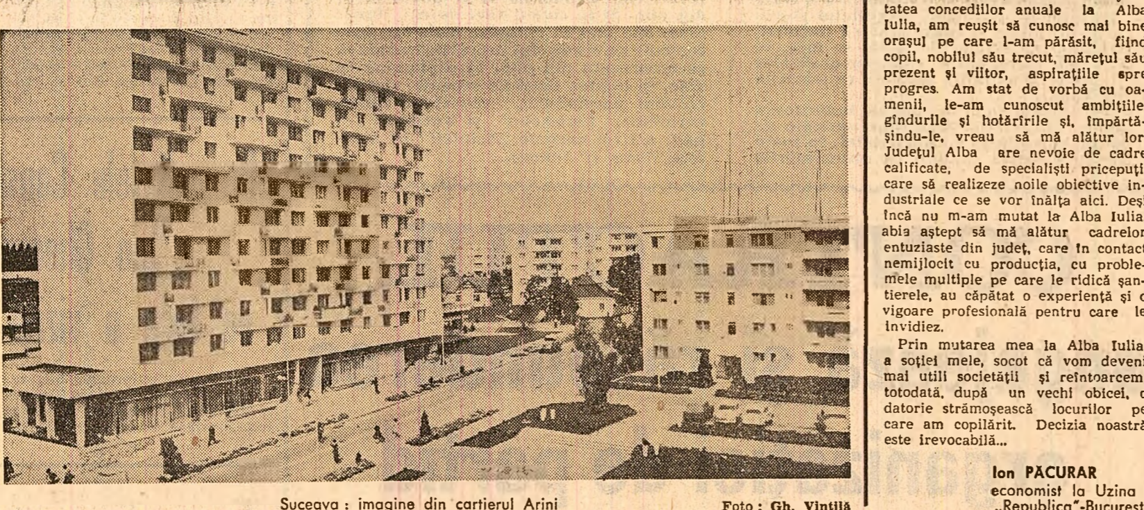
Suceava: imagine din cartierul Arini