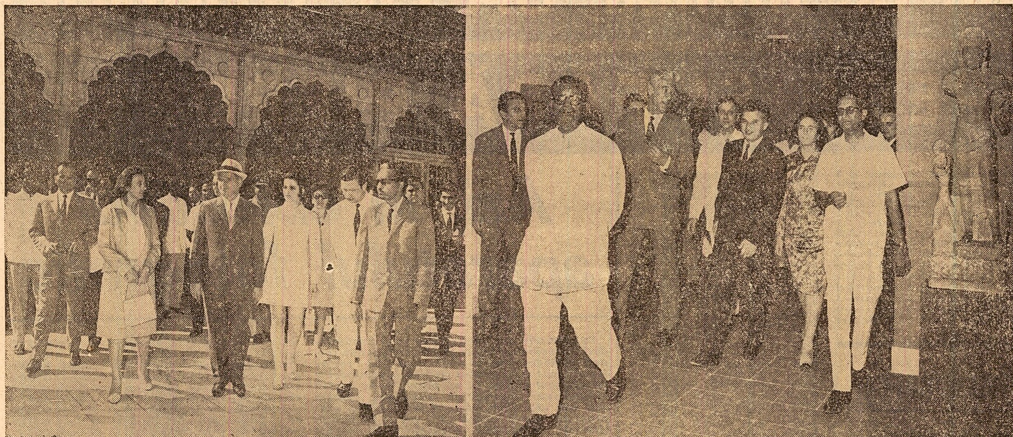
Se vizitează Fortul Agra