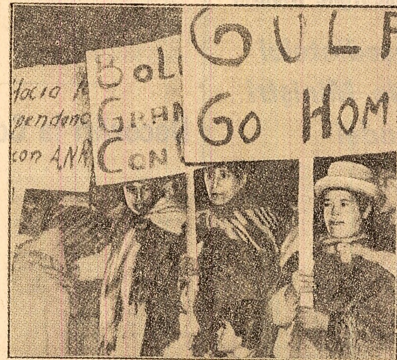
Bolivia — Manifestație pe străzile capitalei, La Paz, în sprijinul hotărîrii guvernului de a naționaliza societatea petroliferă „Gulf Oil”

Successul secretarului general al P.S.U. și eșecul fostului prim-ministru constituie în ochii tuturor observatorilor politici un eveniment de un indiscutabil răsunet. „Avertisment pentru majoritate, și poate,