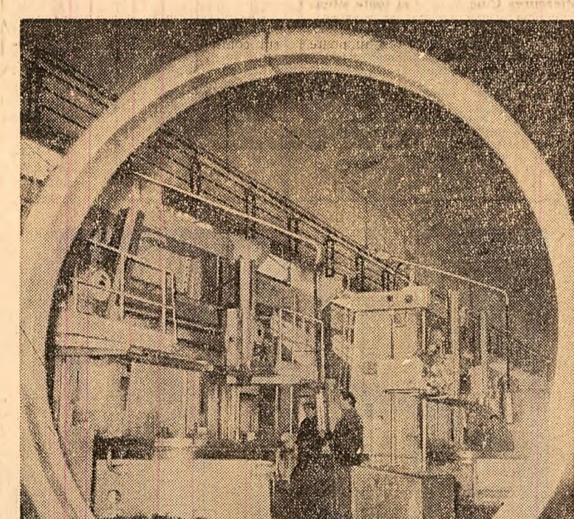
Fabrica de piese de schimb din Găești. Sala de prelucrări mecanice - sectorul greu