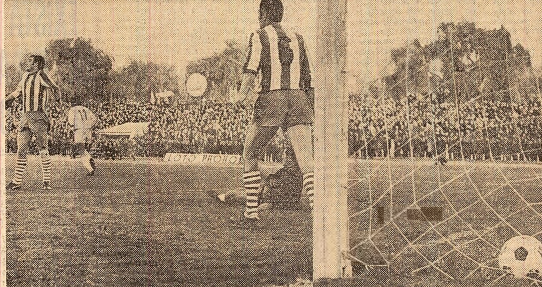
Tricoul arădean cu cifra 6, tabelă de marcaj improvizată... (Dinamo — U.T.A. 6-0!)

FOTBAL — Învingătoare la scor, Dinamo București își menține poziția de lider — Începând de astăzi, fotbalisții greci se pregătesc în... Elveția! Corespondență din Atena de la Al. Ciampau — Elveția și Portugalia, la egalitate — HANDBAL — Lotul reprezentativ și-a început pregătirile pentru campionatul mondial