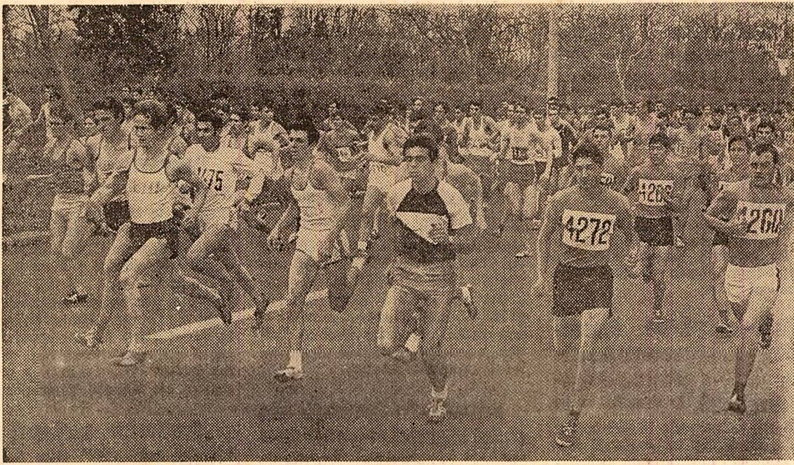
Un start foarte populat în proba juniorilor mari; peste 250 de concurenți

La atletism, calendarul competițional intern se consideră încheiat o dată cu faza finală a campionatului republican de cros. Acest ultim act al competițiilor oficiale în aer liber a avut loc ieri dimineață, lângă parcul Herăstrău, pe un traseu adecvat, apreciat ca atare și de specialiști, și de concurenți.