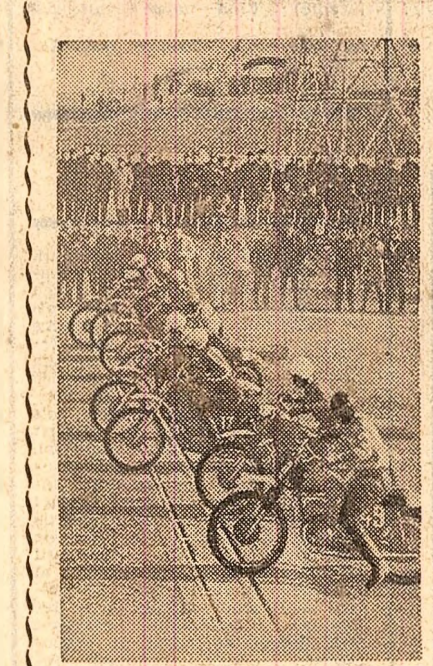
Pe traseul din Pantelimon, în timpul concursului de motocross disputat ieri la omiază