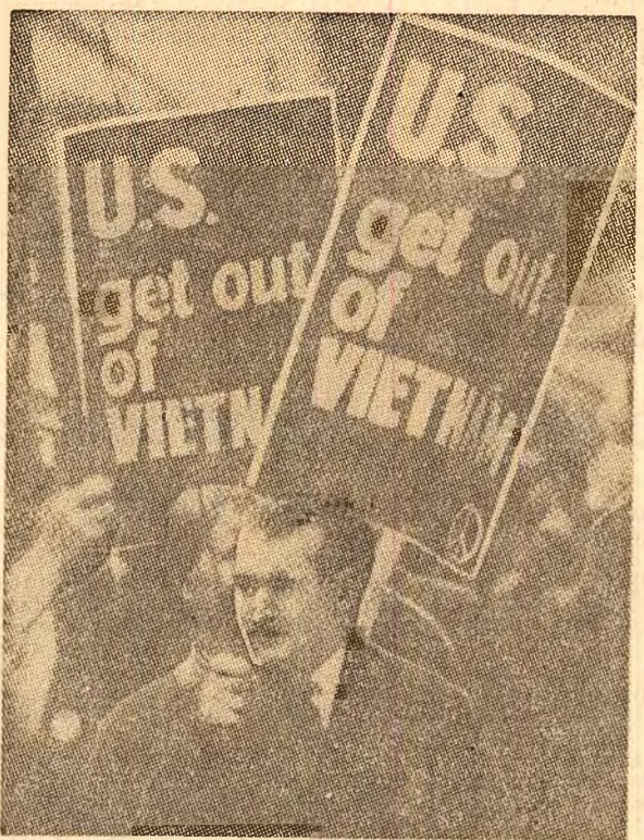
Aspect de la re- centa demonstra- ția la Londra împotriva războiului din Vietnam