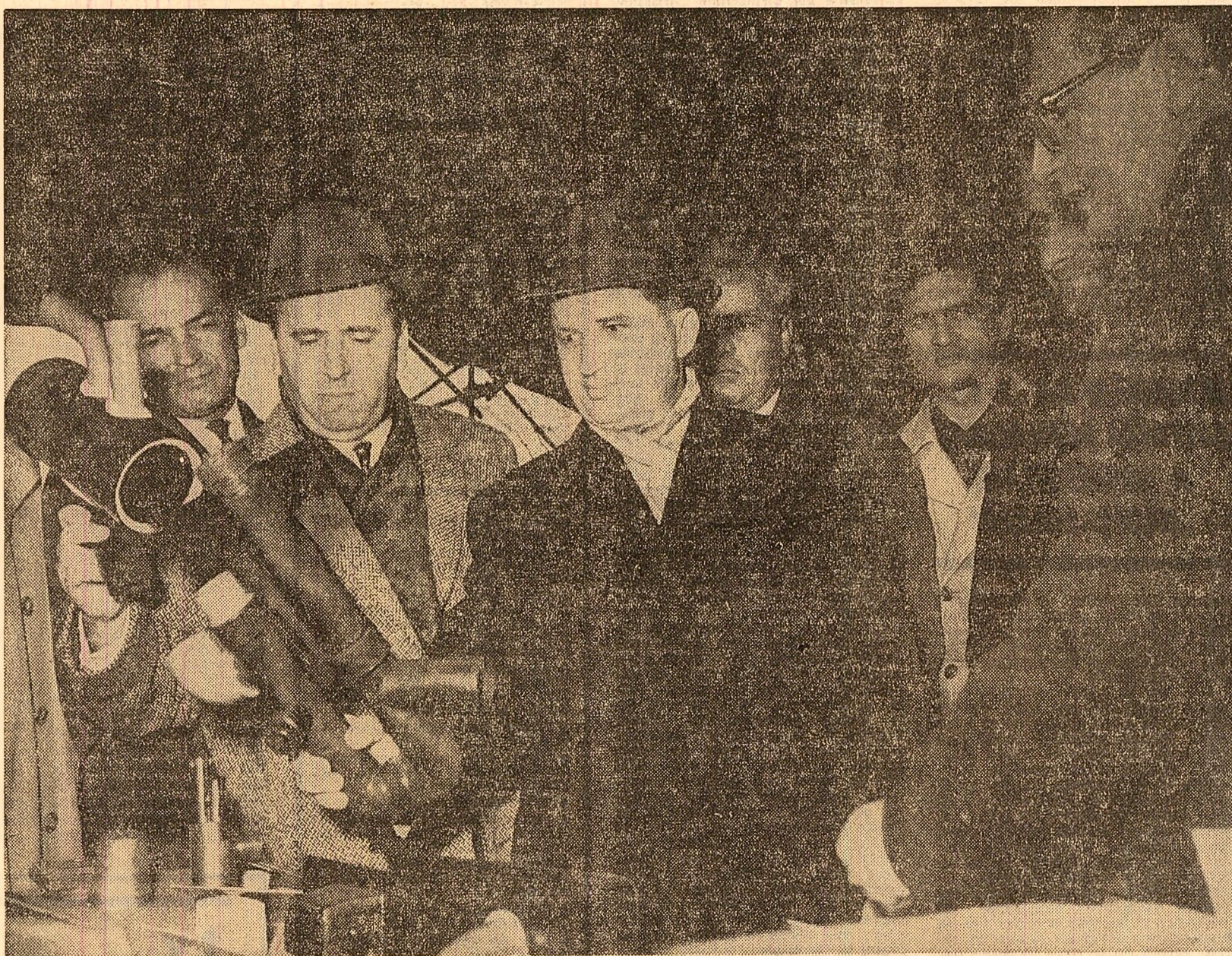
Se examinează noi materiale utilizate în construcții

Ca pretutindeni pe parcursul vizitei, constructorii și locuitorii cartierului salută entuziast prezența tovarășului Ceaușescu, ovaționează pentru partid, pentru politica sa. Se scandează „Ceaușescu!”, „Ceaușescu — P.C.R.”