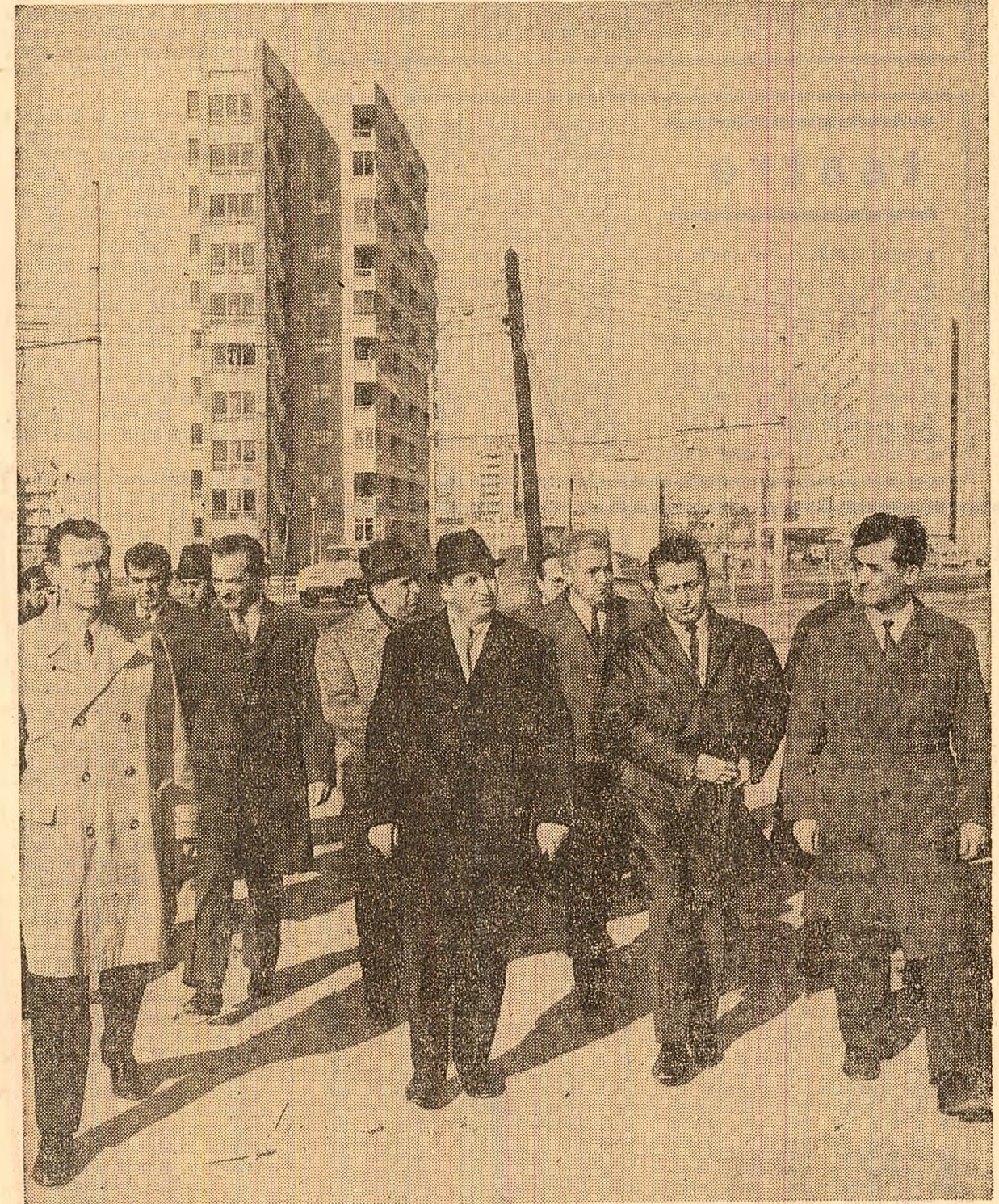
Tovarășul Nicolae Ceaușescu și ceilalți conducători de partid pe unul din șantierul cartierului „Titan”

Comparativ cu anul 1968, în primele 10 luni ale anului în curs, ca urmare a acestor perfecționări tehnice, valoarea produselor obținute dintr-o tonă de țitel prelucrat, a crescut cu 20 la sută. S-a obținut, de asemenea, economii și beneficii suplimentare de peste 15 000 000 lei. (Agerpres)