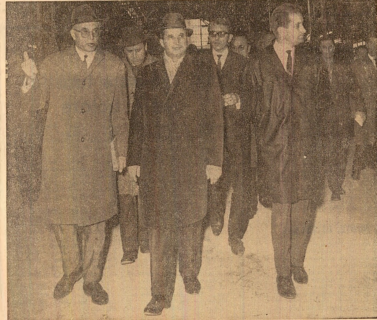
În timpul vizitei la întreprinderea „Granitul”

Tovarășul Nicolae Ceaușescu este invitat să viziteze șantierul acestui bloc cu zece nivele, care, planificat să fie dat în folosință în cursul anului viitor, va cuprinde 275 de apartamente. Aici, directorul general al Direcției generale de construcții-montaj, ing. Octavian Birsan, prezintă principalele caracteristici ale construcției, calitățile materialelor folosite, soluțiile tehnice adoptate la operațiile de montare și finisaj. Sînt vizitate mai multe apartamente, aflate în stadii diferite de execuție. O particularitate a acestui bloc o prezintă folosirea cofrajelor plane