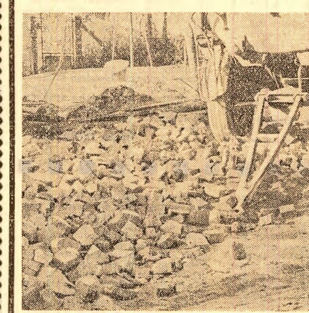
Cărămida zace aruncată prin noroi, iar camioanele circulă peste ea.

Transpunerea în practică a multora din studiile inițiate nu a întîrziat să-și arate roadele. Pe 10 luni din acest an, producția marfă a uzinei a înregistrat, față de plan, un plus de peste 8.000.000 lei. Cu toate acestea însă, nu toate studiile aferente primului semestru au fost aplicate. Ce împiedică oare uzina, forul ei de resort — să ducă la bun sfîrșit o acțiune atît de coincidentă din punct de vedere economic?