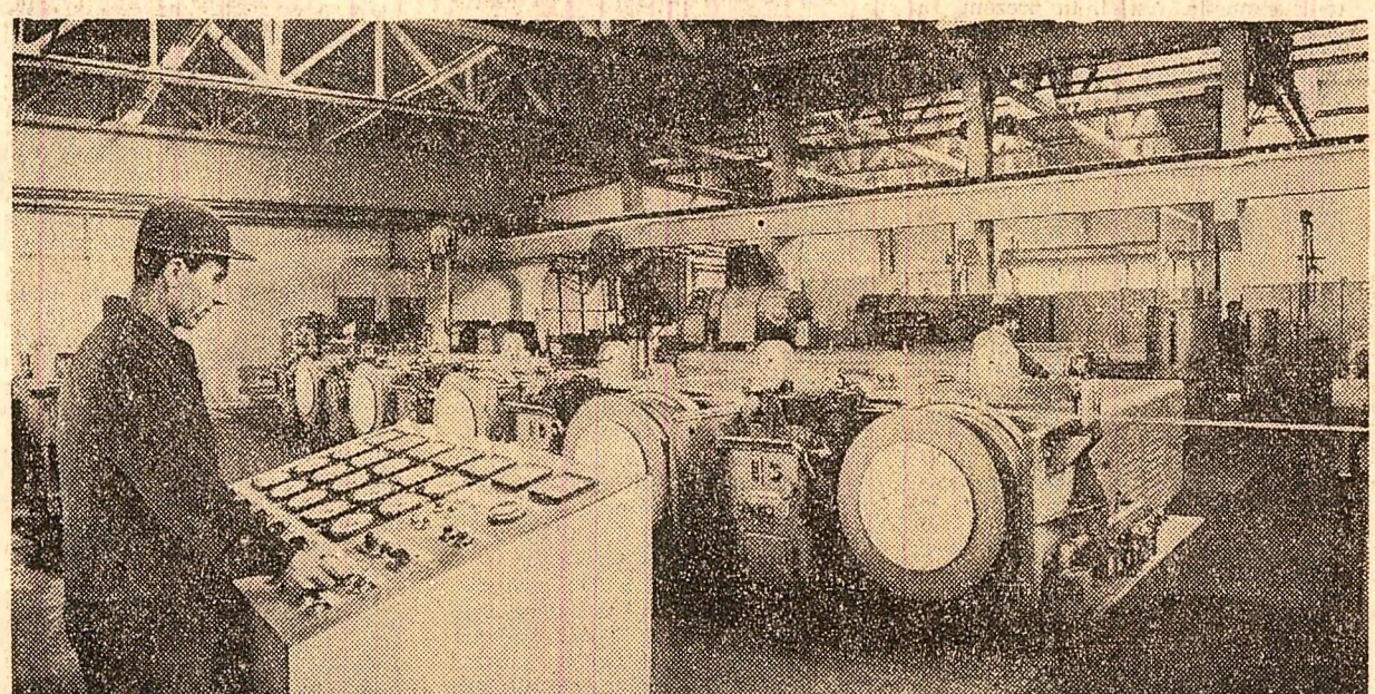
În marea constelație industrială a Capitalei, Fabrica de cabluri și materiale electrozolante se detașează azi ca o unitate de primă mîrime. Aici, prin intrarea în funcțiune a două noi capacități — secția de cabluri de forță și fragătoria de aluminiu — s-a creat posibilitatea să se obțină în anul viitor o producție suplimentară față de prevederile planului cincinal, de aproximativ 300 de milioane lei. În fotografie: șeful liniilor de mașini de treflat, Luca Paraschiv , supraveghînd, la pupitrul electronic de comandă, procesul de fabricație.

În decursul anilor, cooperativele, agricole din județul Buzău și-au dezvoltat necontenit averea obștească care la ora actuală valorează zeci de milioane de lei. Zile dispun de turme și cirezi de animale, de utilaje și nașini agricole, au ecims plantatiile de vi și pomi, au conștinut numeroase sășaposturi pentru animale și magazii pentru cereale etc.